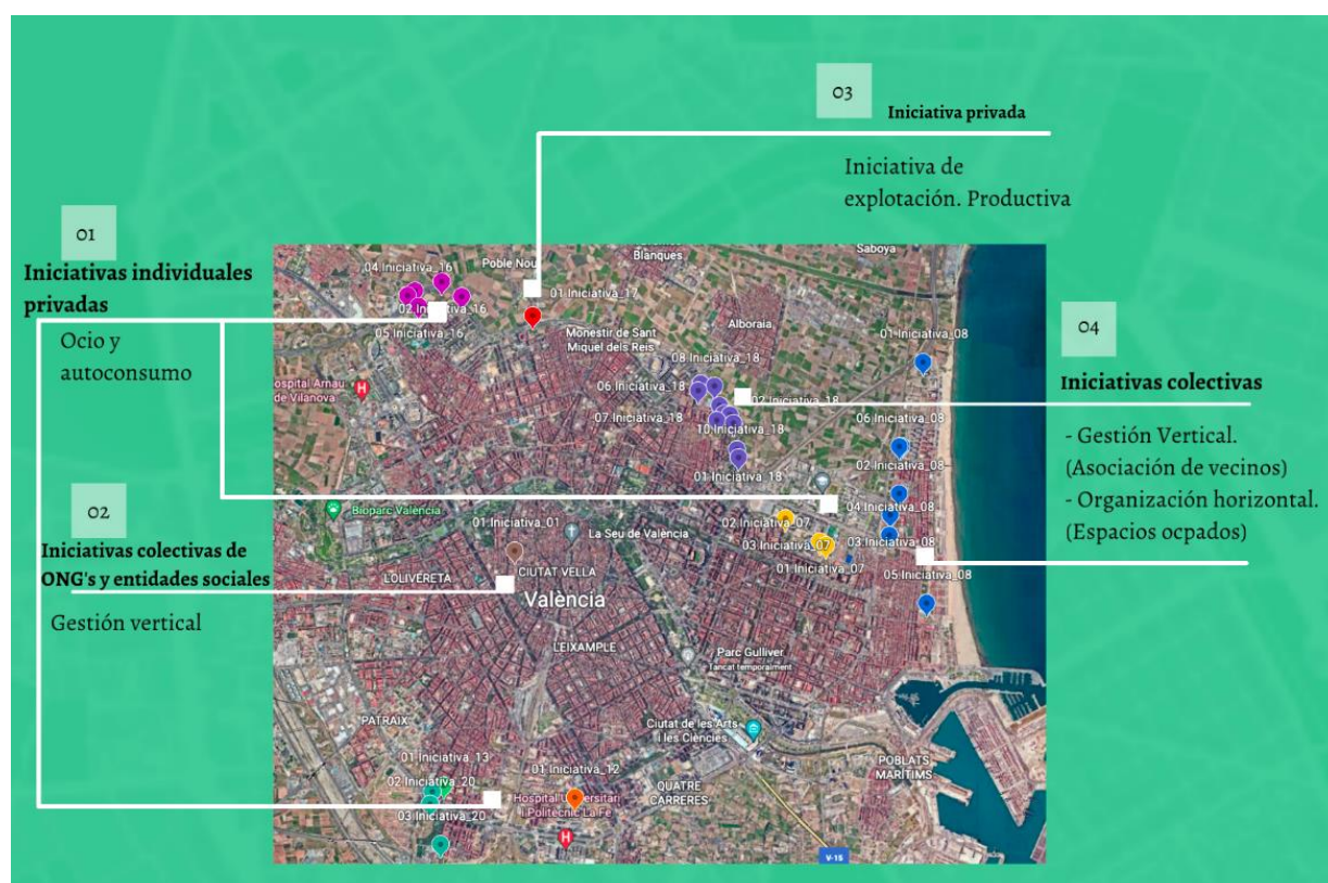
Figura 3. Mapa de iniciativas de agricultura urbana de Valencia diferenciadas a partir del espacio que ocupan y de su organización