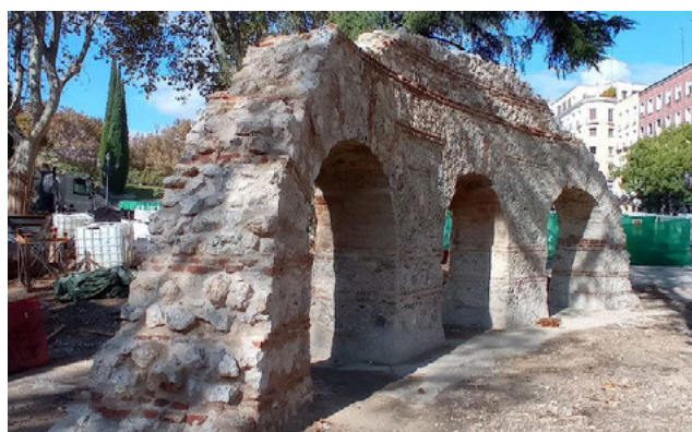
Fig. 4 Vista de los restos del muro que configuraba el paseo de ronda del Cuartel de San Gil aparecidos encajados en el túnel de salida a la calle Ferraz (Madrid) y Fig. 5. Detalle de la estructura en su actual ubicación durante su proceso de reintegración y restauración.

Una vez tomada la decisión, lo complejo fue la intervención para cortar la estructura, trasladarla al exterior y volver a montarla de forma que pueda formar parte del itinerario cultural que se ha configurado (5). La experiencia previa y el buen hacer de la empresa especializada que se encargó de diseñar y llevar a buen término el traslado de la estructura han permitido que pueda ser observada y disfrutada por los miles de personas que pasean a diario por esta zona en la actualidad.