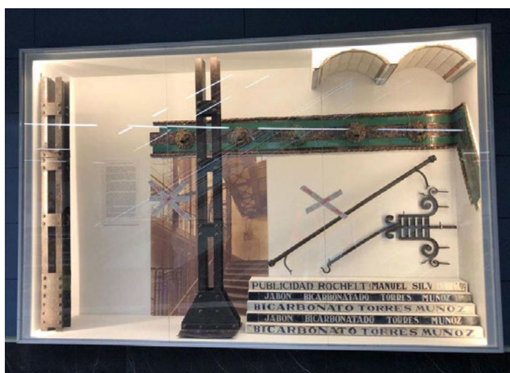
Fig. 2 Vitrina de la musealización realizada en la estación de Metro de de Gran Vía

Finalmente, el trabajo de musealización llevado a cabo por metro de Madrid, dirigidos por el Área de Protección (Fig. 2), nos ha permitido explicar a los usuarios de la red de metro, el origen de la Gran Vía, la arqueología recuperada y la obra arquitectónica de Palacios, cuya impronta en la ciudad de Madrid es todavía visible en edificios tan emblemáticos como el de Correos, sede actual del gobierno municipal.