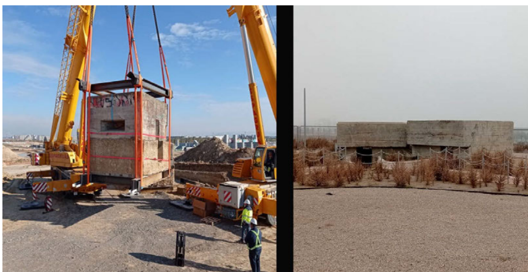
Fig. 3 Imagen del traslado de uno de los búnkeres de la Mata Espesa para la ampliación de IFEMA, y su ubicación final.

La Dirección General de Patrimonio Cultural emitió los requerimientos oportunos para que con la autorización del traslado no sólo quedara garantizada la adecuada conservación del bien cultural, sino para que además se pusieran en valor los fortines. Se estableció la necesidad de llevar a cabo la excavación, limpieza y desescombro de los fortines y de las trincheras que ya habían sido objeto de estudio, sondeos arqueológicos para intentar localizar las líneas de trincheras que se observaban en las fotografías aéreas, de la década de 1940, control y seguimiento arqueológico de todos los movimientos de tierras del vaciado de la parcela, y elaboración de paneles informativos tras la actuación, siguiendo las directrices del Área de Protección. Fue necesaria la Supervisión por un restaurador de Bienes Culturales, junto a la dirección arqueológica, de los trabajos de limpieza de paramentos (eliminando los impactos negativos, en especial las pintadas con grafitis), desmontaje, traslado, reubicación de los fortines, incluyendo la banqueta de ladrillo situada dentro del fortín nº 1, y la recreación de las trincheras (Fig.3).