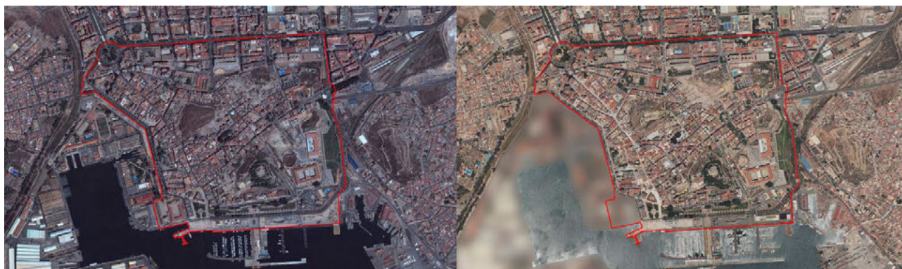
Fig. 1 Ortofotografías del ámbito ordenado por el PEOCH en 2005 (izquierda) y 2019 (derecha). PNOA-IGN

Los datos de paro, de la serie de Paro Registrado del Centro Regional de Estadística de la Región de Murcia ( https://econet.carm.es/web/crem ), del ámbito del CH-CT son inferiores a los de sus alrededores y muy similares a los del Ensanche, ambos con un porcentaje medio de parados menor al 8% del total de la población. Sin embargo, desde 2011 son más las zonas en las que el paro aumenta que en las que disminuye. Además, existen serias desigualdades entre las distintas áreas que, ya que en el año 2020 había zonas que se encontraban en torno al 4% de paro, mientras que otras superaban el 14%. En cuanto a la renta, en 2018 contaba con los datos de renta neta media por hogar más favorecedores del casco urbano de la ciudad, con un promedio que se situaba en 39.000 €. En ese mismo año, la renta bruta media por persona se acercaba a los 19.000 € anuales. Sin embargo, hay que tener en cuenta que hay algunas áreas —cuya población supone más del 44% de los habitantes del conjunto histórico— en las que la renta se sitúa por debajo de ese umbral, lo que deja de manifiesto las desigualdades existentes en este ámbito. Por una parte, está la zona cercana a plaza de España y situada en el entorno de la calle Real, donde la renta bruta media por persona supera los 24.000 €. En el lado contrario se encuentra la zona sur de Monte Sacro donde la renta no alcanza los 10.000 € anuales.