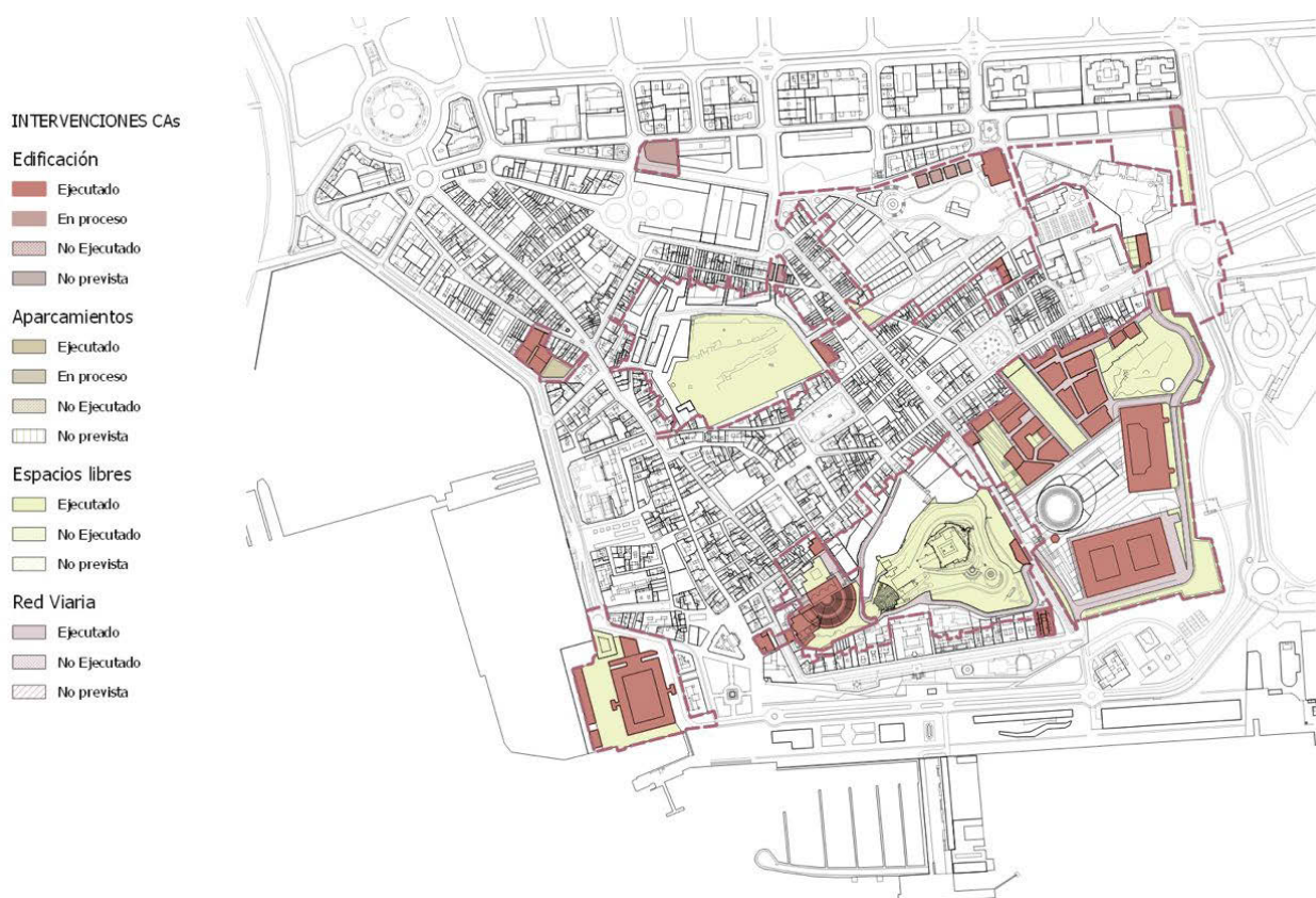
Fig. 2 Estado de las actuaciones previstas por el PEOCH en las áreas de intervención

La CA-4 es un área extensa de 11,6 ha en torno al cerro de Despañaperros compuesta por seis unidades de actuación. Se ordenó en 2000 por el PERI de la Universidad, aunque las expropiaciones y demoliciones en masa había comenzado en 1998 en la UO-1 y UO2, en 1999 en la UO-3 (finalizadas en 2003). Las demoliciones en la UO-4 se realizaron en 2004 y 2005.