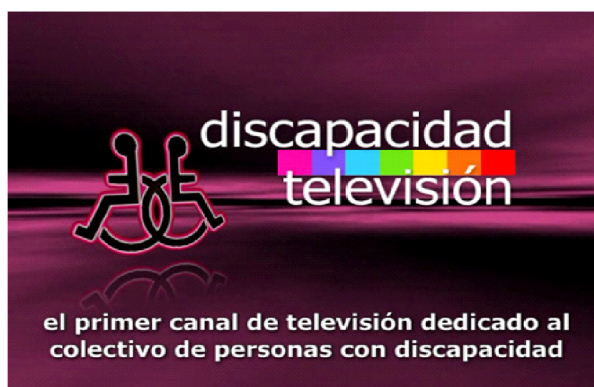
Figura 3.23 Logo sitio web Discapacidad Televisión

En cuanto a otros temas, la web para personas con diversidad reúne “todos los aspectos de la vida social (...) encuentran atención la prevención, la rehabilitación, la asistencia de mantenimiento y la equiparación de oportunidades (...) La discapacidad, a través de sus emisores, va adquiriendo cada vez más las posibilidades de expresión dentro de lo que puede llamarse “la cultura informática. Va creando su propio lugar, tratando de