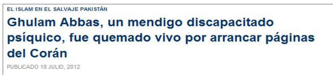
Figura 3.3 Mundo digital 18/07/12

Disminuido : Que ha perdido fuerzas o aptitudes, o las posee en grado menor a lo normal. Por debajo de lo normal.