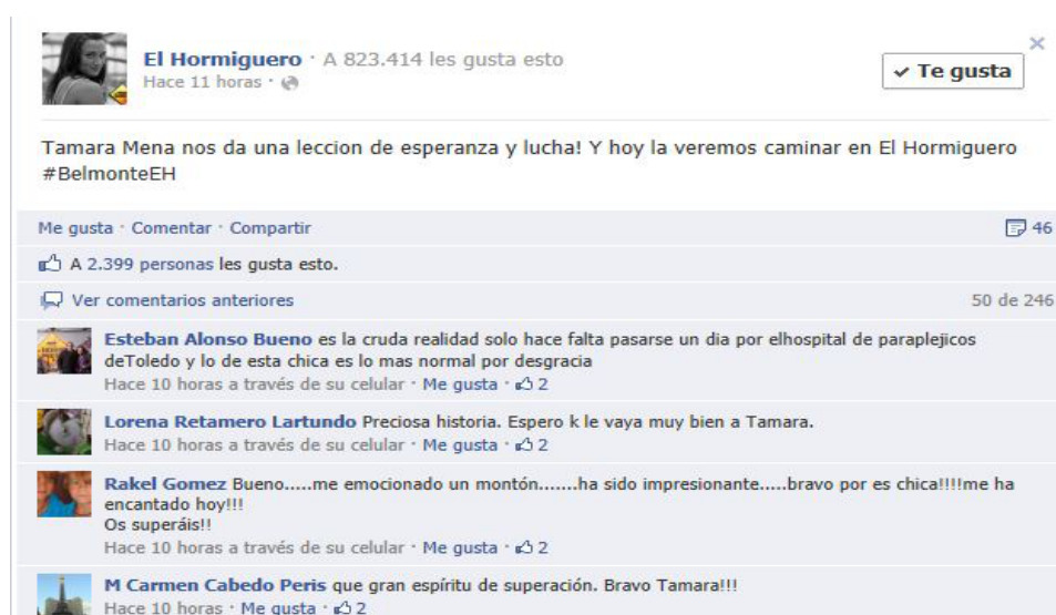
Figura 3.24 Red Social, comentarios sobre el programa El Hormiguero 06 de septiembre de 2012

Hay un carácter sensacionalista en todo lo que rodea a la diversidad funcional a través de los medios. Si fallece una persona que se desplaza en silla de ruedas, el titular va marcado por qué estaba impedido. Todo lo que sea despertar la atención del espectador a través de lo emotivo, de lo que nos pone los pelos de punta... todo esto es la tele de hoy en día. (y en horario infantil...). Sólo hay que leer los comentarios que en menos de diez horas se dejaron, a través de la red social de facebook, en relación a lo que comentaba sobre el programa de El Hormiguero del 06 de septiembre de 2012. 174