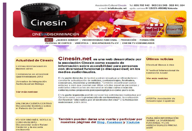
Figura 3.21 Inicio sitio web Cinesin

Las Asociaciones de personas con diversidad funcional, como ya introducíamos, también disponen de sitios web donde se puede obtener toda la información relacionada con las actividades de la propia asociación, voluntarios, links a otras entidades... Estas webs son “una nueva y moderna ventana desde donde hacerse conocer y escuchar, una nueva manera de perder la invisibilidad que caracteriza a aquellos colectivos que encarnan la diversidad, respecto del promedio o prototipo socialmente aceptado por una comunidad.” 161