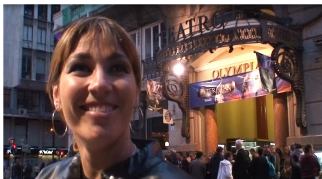
Figura 7.1 Imagen piloto

Si nos fijamos en el plano del reportaje, la silla de ruedas toma cierto protagonismo. Yo creo que esto ya es un error, y lo veremos en las estrategias de la realización audiovisual y el modo de representación. La silla de ruedas no habla, habla Ruth. Un plano correcto sería el siguiente: