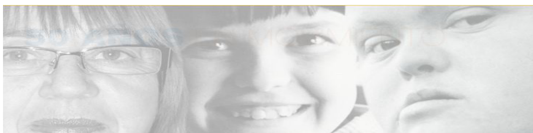
Figura 3.16 Animación web Asprona

Este sencilla relación entre personas con diversidad y las que, vamos a decir que no, o por lo menos que dan la imagen de que no tienen diversidad funcional, supone una mayor identificación por el observador. Otras webs, no hacen uso alguno de la imagen diversidad,