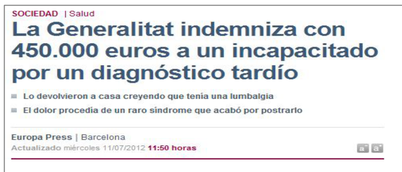
Figura 3.5 El Mundo 11/07/12

Incapacitado : Falto de capacidad o aptitud para hacer algo.