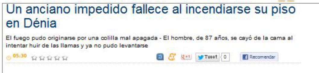
Figura 3.4 Prensa Levante 24/07/12

“La colaboración vecinal evita que tres personas impedidas mueran abrasadas en su vivienda”. 99