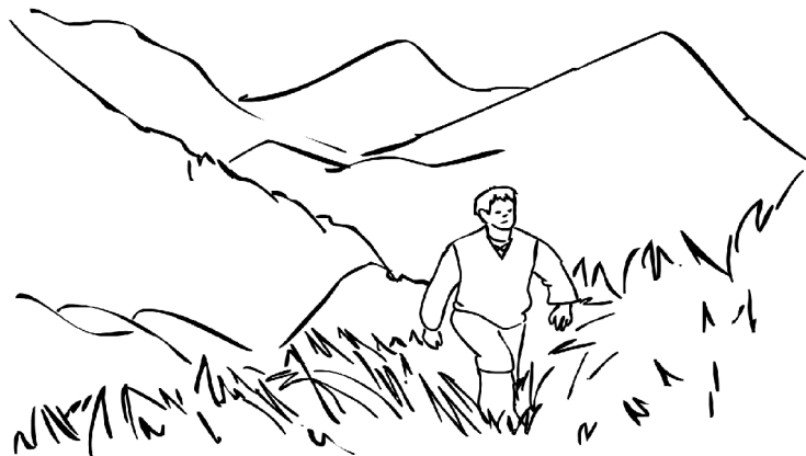
Figura 8.1 Comienzo de los créditos.