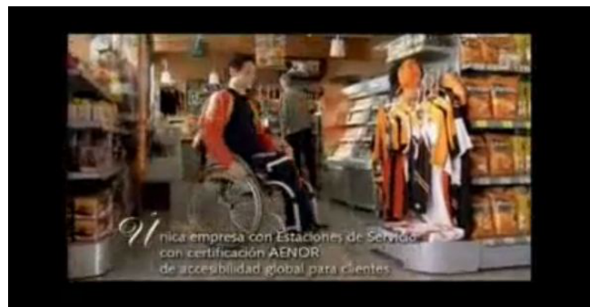
Figura 3.25 Spot Repsol

En este spot dos chicos van a un lavadero de una gasolinera de Repsol, y les atiende un chico con diversidad funcional. Cuando se marchan el copiloto le dice al piloto “¿Te has fijado?” y el piloto le contesta “Sí. Siempre que lo traigo a lavar, se pone a llover” Creemos que es un fantástico mensaje con el que incluso se está mencionando entre líneas las capacidades de las personas con diversidad que no siempre se nombran.