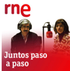
Figura 3.15 Cartel Juntos paso a paso

A modo de ejemplo, RNE tiene el programa Juntos paso a paso 136 , donde las personas mayores y aquellas con diversidad funcional son los protagonistas. Este programa de servicio público está especializado en información referente a personas mayores y personas con diversidad funcional dos colectivos con “dificultades a la hora de hacerse oír y de recibir información de utilidad. Desde este programa se aborda el envejecimiento y la discapacidad desde todas las facetas posibles con una orientación positiva y optimista: accesibilidad, adaptabilidad e integración social y laboral de personas con discapacidad, envejecimiento activo, cultura, legislación, temas relacionados con la salud...” 137