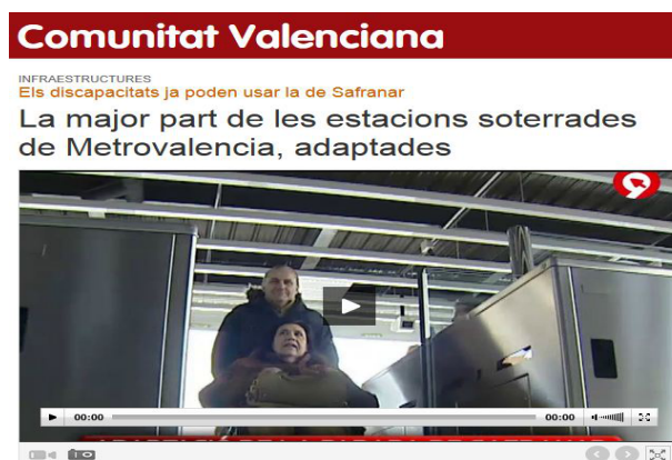
Figura 3.14 Mediateca Canal 9 06/02/12

En muchos casos (fig. 3.13 y 3.14) se cubren todo tipo de noticias relacionadas con la accesibilidad en diversas infraestructuras, como los medios disponibles en las playas y en el metro para personas con diversidad funcional.