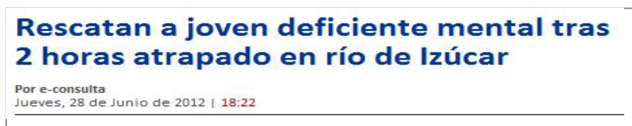
Figura 3.1 Prensa Internacional 28/06/12

Esta es quizá uno de los términos más peyorativos que puedan existir.