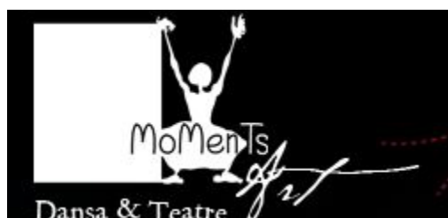
Figura 3.18 Logo Moments d'Art

La Comisión Interministerial de la Sociedad de la Información y de las Nuevas Tecnologías, abre en el año 2000 a través del Programa de Fomento de la Investigación Científica y Técnica, una línea para favorecer el acceso de las personas con diversidad funcional a la sociedad de la información. Esta iniciativa