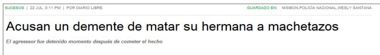
Figura 3.2 Diario Libre 22/07/12

Disminuido : Que ha perdido fuerzas o aptitudes, o las posee en grado menor a lo normal. Por debajo de lo normal.