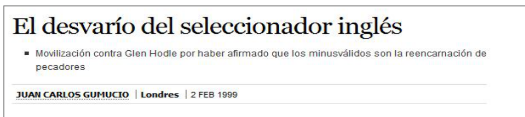
Figura 3.7 El País 02/02/1999

Mongólico : Palabra utilizada para identificar a personas con síndrome de Down.