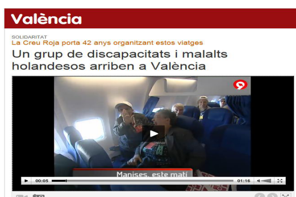
Figura 3.11 Noticia Canal 9 15/09//2012

Pero las noticias que Canal 9 ofrece en cobertura a los colectivos de diversidad funcional, no sólo cubren la parcela del deporte, ni tampoco de infraestructuras e innovación en accesibilidad (que también lo hace) sino, cualquier tipo de noticia que en se produce en la Comunitat con personas venidas incluso de fuera. Es decir, se amplía a cualquier tipo de evento en pro de la normalización. En el ejemplo de a continuación, se recogía la noticia de la visita de un grupo de holandeses con diversidad funcional a Valencia. El evento lo organizó Cruz Roja y también fue cubierto por otros medios. Llama la atención que la palabra “discapacitado” sigue siendo en todos los medios un estereotipo a eliminar en el discurso mediático.