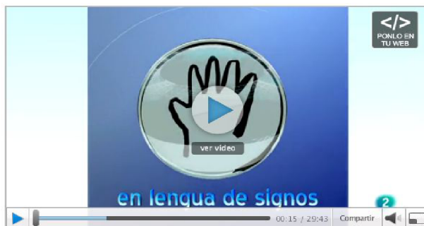
Figura 3.22 Sitio web RTVE Televisión a la carta

Desde la web, existe un caso único a nivel mundial que es “Discapacidad televisión”, un programa que se realiza desde Argentina cuyos contenidos se relacionan con la diversidad funcional.