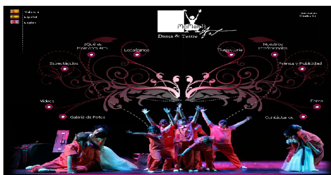
Figura 3.17 Inicio web Moments d'Art

Este sencilla relación entre personas con diversidad y las que, vamos a decir que no, o por lo menos que dan la imagen de que no tienen diversidad funcional, supone una mayor identificación por el observador. Otras webs, no hacen uso alguno de la imagen diversidad,