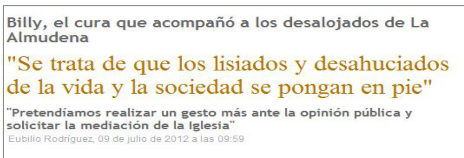
Figura 3.6 Libertad Digital 09/07/12