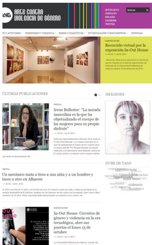
Figura 1. ACVG, www.artecontraviolenciadegenero.org Plataforma de lucha contra la violencia de género, creada 2010.

carencia importante que se viene detectando en la investigación y en la docencia en el área del arte en relación a los estudios de género, referida concretamente a la escasa información, y poco actualizada, acerca de las intervenciones artísticas de mujeres y hombres en el ámbito tecnológico frente a la violencia de género. En este sentido, el Laboratorio de Creaciones Intermedia (LCI) está potenciando sus líneas de investigación a través de las capacidades definidas como: "Producción en arte intermedia", "Producción en Estudios Artísticos de género" y "Producción en Arte Público". Hemos realizado diversas exposiciones, publicaciones e intervenciones en la esfera pública y tecnológica (programas de televisión como los Antispots , publicaciones sobre género y tecnología, intervenciones artísticas en las calles y proyectos en Internet).