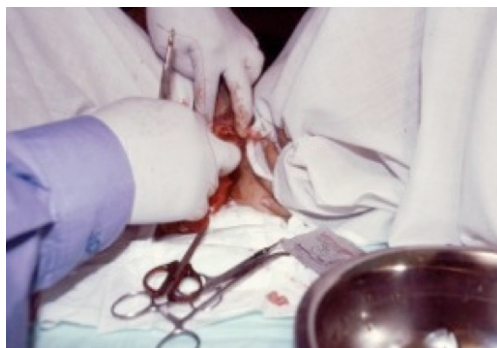
Figura 4. Regina José Galindo, Himenoplastia , 2004. Performance y video.

La artista y activista norteamericana Suzanne Lacy ha dedicado toda su labor a la lucha contra la violencia de género, desde su libro pionero Rape is , de 1972, que confronta diferentes definiciones de la palabra violación sin acudir a imagen alguna; hasta su famosa performance Three weeks in May , de 1977, realizada en distintos lugares de la ciudad de Los Ángeles, incluyendo el Ayuntamiento. La acción consistía en la creación de un mapa a partir de las violaciones, durante tres semanas en mayo. Se sacaron estadísticas y se colaboró