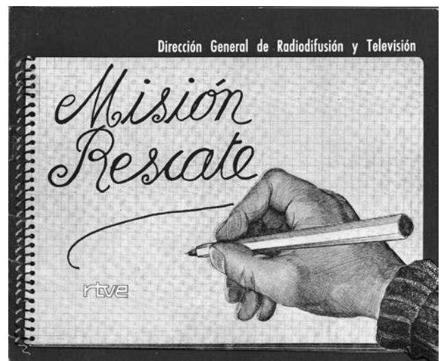
Figura 8. Logo publicitario de Misión Rescate.

El Doctor Calatayud Payà, opinaba que no hay duda sobre la época a (la) que pertenece esta pintura que bien pudiera ser de mediados del 1.700 por la clase de lienzo, bastidor y unión de las telas. La escuela de Juanes o de alguno de sus alumnos más allegados (sus hijas por ejemplo) que usaron en sus obras los patrones del maestro guardados en su taller. ¿La muerte de la madre Jerónima, no pudo influir y quedar plasmada en esa simbólica composición del agonizar un cuerpo y glorificar un alma que velará desde el cielo sobre su pueblo natal?. Al igual que Roig d'Alós, no comparte la opinión de los profesores catalanes sobre la imagen de Jesús de la parte superior, ya que no concibe un Jesús arrodillado, sosteniendo su propio corazón y bajo el propio cuerpo y todo ello sobre el "Divino Pastor" que repetiría un Jesús más sobre el mismo lienzo. Por ello opinamos que es un San José sin sus símbolos pero arrodillado como su esposa y