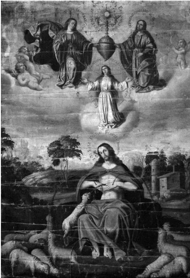
Figura 1. El Buen Pastor , Anónimo valenciano de la segunda mitad del S. XVII. Parroquia de San Pedro de La Poble Llarga, Valencia