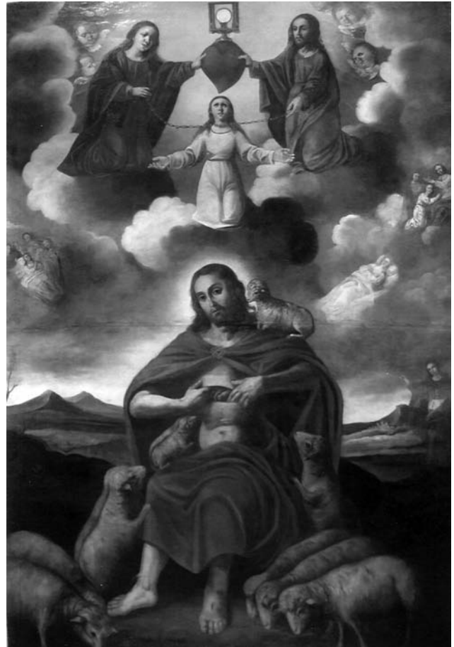
Figura 2. El Buen Pastor , Anónimo valenciano de la segunda mitad del S. XVII. Parroquia del santo Ángel Custodio de la Vall d'Uixó, Castellón

En 1955 lleva a cabo la restauración de la Fuente del Negrito en la plaza de Calatrava una de las más emblemáticas de la ciudad de Valencia. Dentro de la labor de recuperación de obras escultóricas y monumentales cabe destacar la restauración integral de las Rocas de la festividad del Corpus, por encargo del Ayuntamiento de Valencia. Sin lugar a dudas, cabría definir a Roig d'Alós como restaurador de