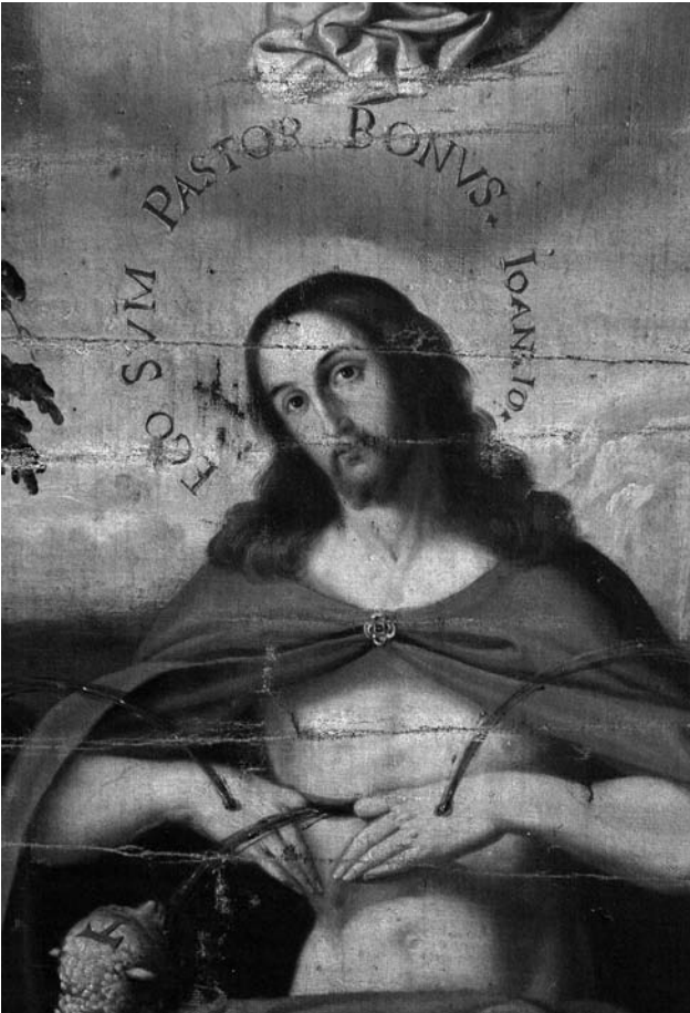
Figura 3. Detalle del rostro del Buen Pastor . Parroquia de San Pedro de La Poble Llarga.