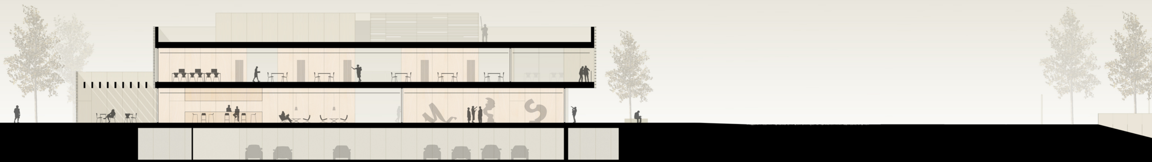
SECCIÓN CAFETERÍA 1/200