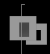
SECCIÓN ACCESO 1/50