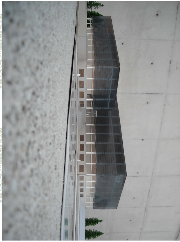
SECCIÓN AA' E:1/200