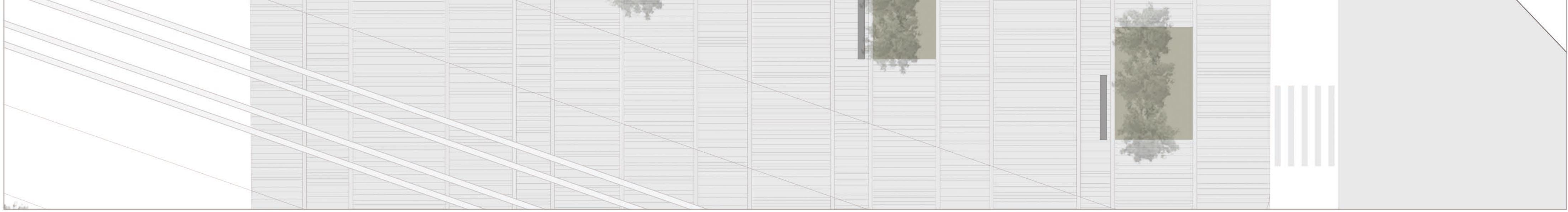
planta intermedia e:1/200