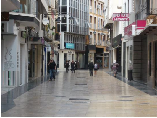
Fotografía 37 Carrer Major.