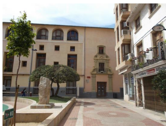
Fotografía 30 Otra vista de la fachada del antiguo Convento de Sant Roc.