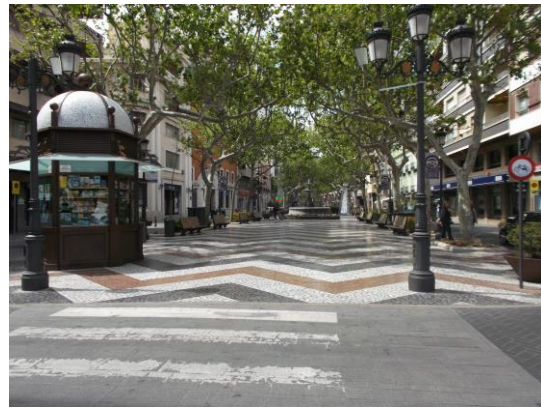
Fotografía 24 Passeig de les Germanies.