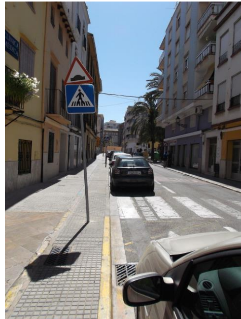
Fotografía 10 Carrer Carmelites.