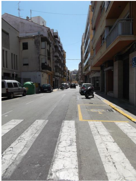
Fotografía 9 Plaça de la Duçessa María Enríquez.