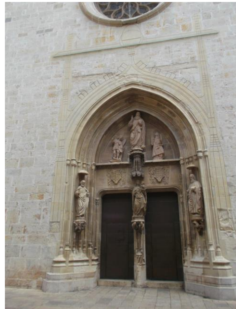
Fotografía 20 Puerta de los Apóstoles de la Colegiata de Gandia.