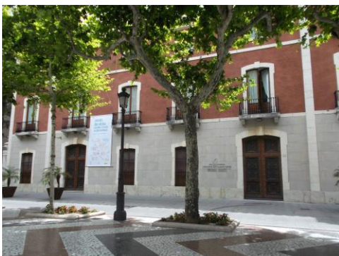
Fotografía 25 Fachada de la Casa del Marqués González de Quirós.