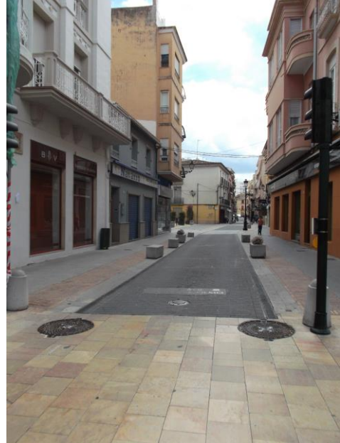
Fotografía 6 Carrer Sant Pasqual.