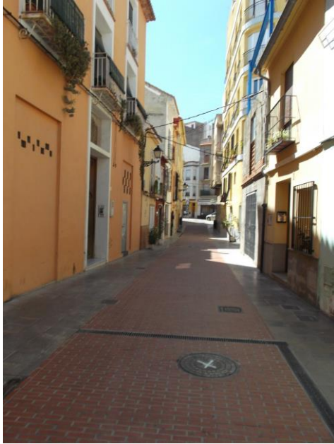
Fotografía 13 Carrer de L'Hospital.