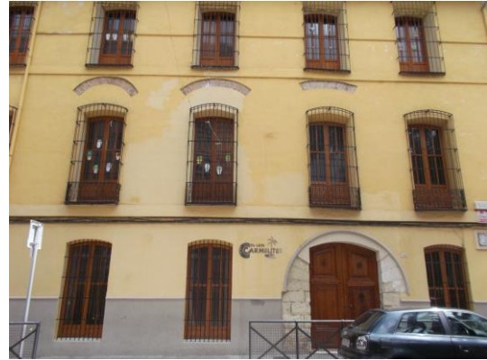
Fotografía 14 Fachada de la antigua casa de los Vich. Actual colegio de Las Carmelitas.