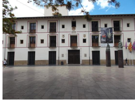
Fotografía 38 Plaça Escoles Pies, donde se encuentra el edificio de la Antigua Universidad de Gandia del siglo XVI, cuya fachada podemos apreciar en esta imagen.