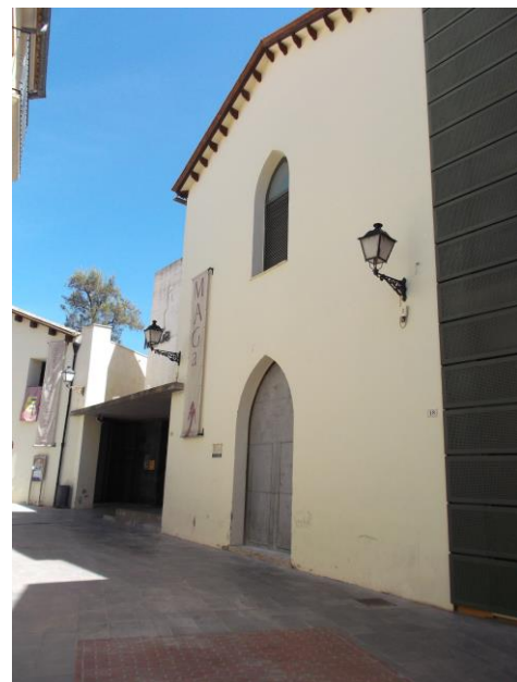
Fotografía 12 Fachada del antiguo Hospital de Sant Marc. Actual Museo Arqueológico de Gandia (MAGa).