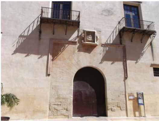
Fotografía 23 Puerta de entrada al Palacio Ducal de Gandia.