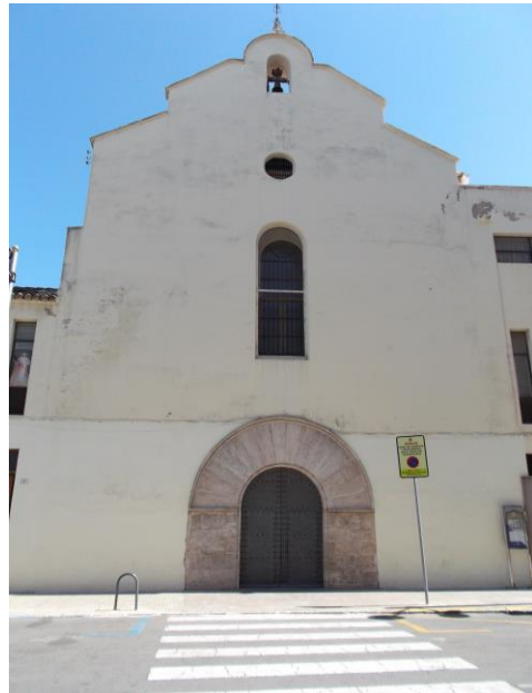
Fotografía 8 Puerta de la Iglesia de Santa Clara.