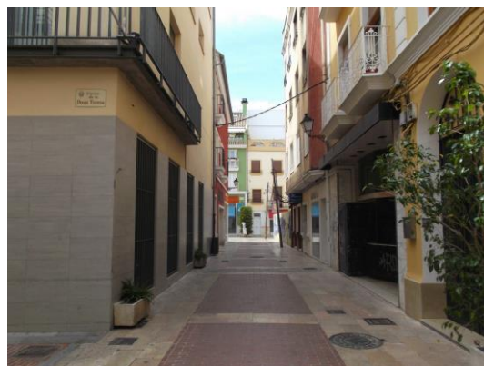
Fotografía 32 Carrer Sant Roc.