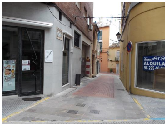
Fotografía 11 Carrer de la Germana Rita (Carmelita).