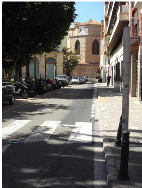
Fotografía 15 Carrer Plaça de la Vila.