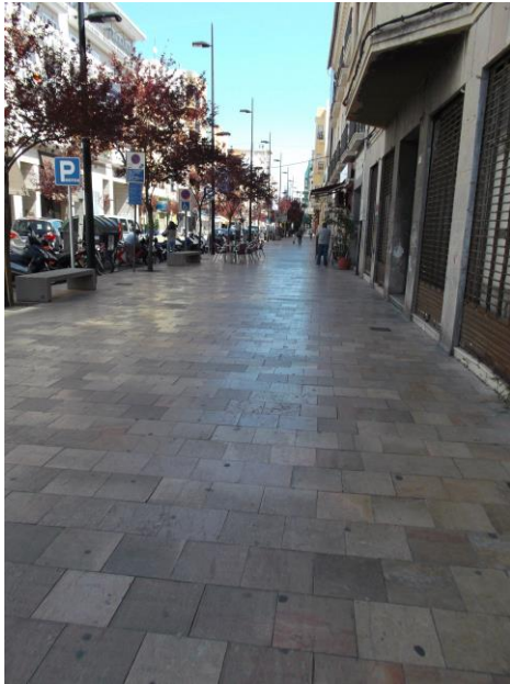
Fotografía 5 Avinguda d'Alacant.