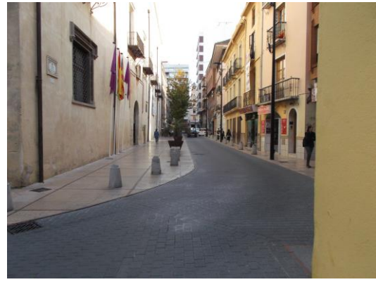
Fotografía 22 Carrer Duc Alfons el Vell.