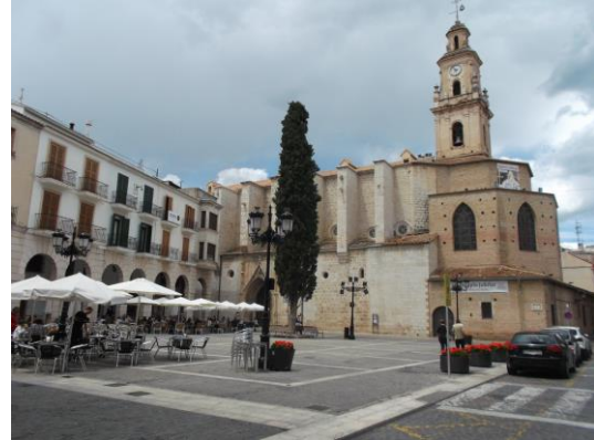
Fotografía 17 Vista de la Plaça Major desde el otro extremo, junto a la esquina del carrer Ausias March. Se puede apreciar el magnífico monumento de la Colegiata de Gandia.