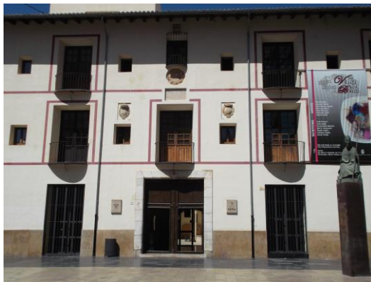
Fotografía 39 Puerta de entrada al edificio de la Antigua Universidad de Gandia, actual colegio de Los Escolapios.