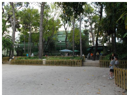
Fotografía 26 Jardines de la Casa del Marqués González de Quirós.