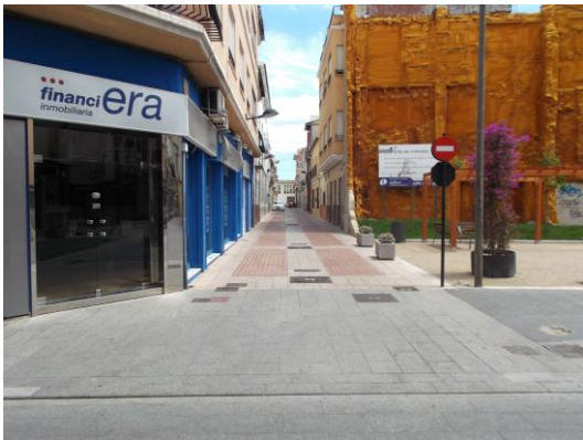
Fotografía 7 Carrer Sant Bernat.