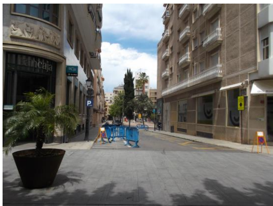
Fotografía 27 Carrer Mestre Giner.