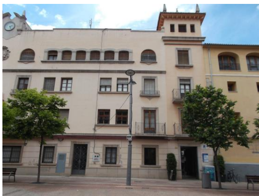
Fotografía 29 Fachada del antiguo Convento de Sant Roc.