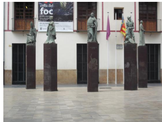
Fotografía 40 Estatuas de la familia Borja que se encuentran en la Plaça Escoles Pies, donde finalizaría el itinerario. Al lado se encuentra el Racó del Pare Leandro Calvo.