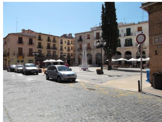
Fotografía 16 Plaça Major, donde se encuentra la Colegiata y el Ayuntamiento de Gandia.