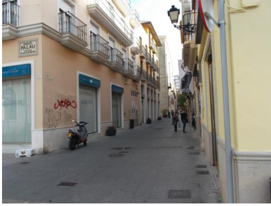
Fotografía 21 Carrer d'Ausias March.