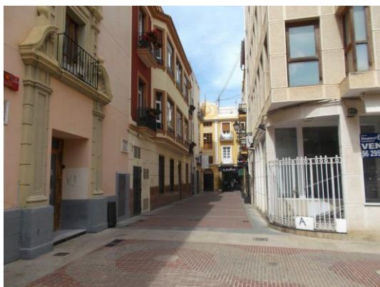
Fotografía 31 Carrer de la Dona Teresa.