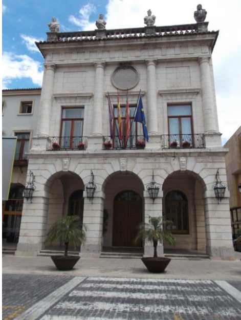
Fotografía 18 Fachada del Ayuntamiento de Gandia.