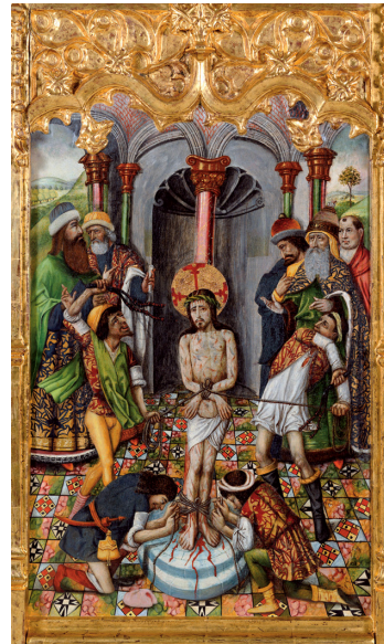
Fig. 3. Joan Reixach, Flagelación de Cristo de la predela de la Pasión del retablo dedicado a los Siete Gozos de la Virgen del Monasterio de Portaceli, h. 1460, Museo de Bellas Artes de Valencia (inv. 208).