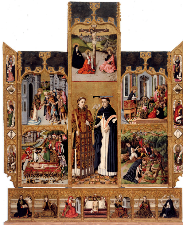
Fig. 4. Joan Reixach-Jacomart. Retablo de San Lorenzo y San Pedro de Verona , 1460, Iglesia Parroquial de Catí.