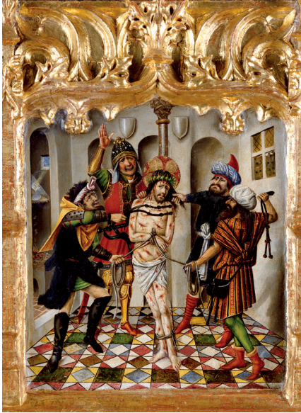
Fig. 2 Joan Reixach, Flagelación de Cristo de la predela de la Pasión , h. 1450, Museo de Bellas Artes de Valencia (inv. 2101).