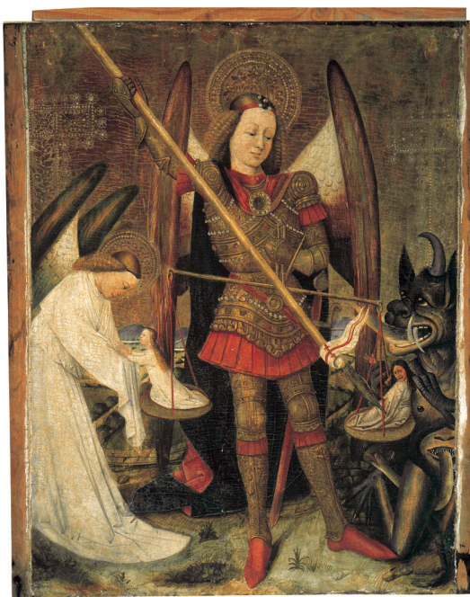
Fig. 6. Jacomart (?). San Miguel pesando las almas , h. 1441, Galleria Parmeggiani de Regio Emilia, procedente de la Iglesia Parroquial de Burjassot (Valencia).

mera vez documentado como mayor de edad trabajando en Zaragoza 5 . Poco conocemos de sus trabajos iniciales, salvo algunas referencias documentales de obras a día de hoy perdidas, como el Retablo de la advocación de los Siete Gozos de María , destinado a una capilla de una huerta cercana al desaparecido Palau Reial de Valencia (1437-1440), aunque sabemos que este retablo acabaría yendo a parar a la capilla del Castillo de Xàtiva (1439-1440).