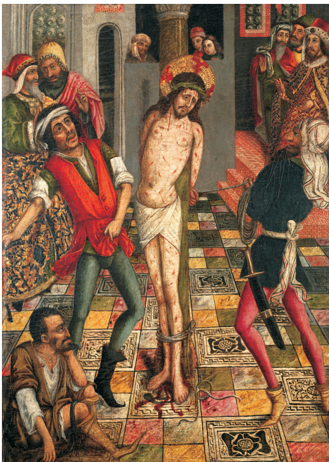
Fig. 1. Joan Reixach, Flagelación de Cristo , h. 1455, colección Laia Bosch.

comercio de este tipo de producto manufacturado que, a través del creciente puerto de Valencia, se exportaba al exterior. Así pues, Reixach, deudor del ambiente en el que nació, decidió eliminar los monocromos suelos de sus interiores y decorarlos al estilo de los palacetes medievales valencianos. Este tipo de alicatado que apreciamos en la tabla de la colección Laia-Bosch, lo encontramos también, por ejemplo, en una de sus pocas obras firmadas, el Retablo de Santa Úrsula , conservado en el MNAC de Barcelona, que procedería del mismo periodo que la tabla que analizamos. Del mismo modo aparece en el Retablo de San Lorenzo y San Pedro de Verona de Catí (fig. 4), obra contratada en 1460 por Jacomart, aunque con segura participación del taller de Reixach.