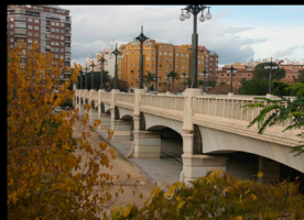
F_ANTIQUO CAUCE DEL RIO TURIA

SE PROPONE LA CREACIÓN DE UNA RED DE ESPACIOS VERDES, OCUPANDO Y ADECUANDO ESOS VACÍOS URBANOS PRÓXIMOS A LA PARCELA. ESTA RED CONECTARÁ EL PARQUE DEL ANTIGUO CUACE DEL RIO TÚRIA CON EL PARQUE DE AYORA. EL NEXO DE UNIÓN PRINCIPAL DE ESTOS ESPACIOS VERDES SERÁ LA CALLE PINTOR MAELLA, POR DÓNDE ESTÁ PREVISTO QUE PASE LA NUEVA LÍNEA DE TRANVÍA. AQUÍ SE INTEGRARÁ LA MÁQUINA DENTRO DE ESTA RED, TRANSFORMANDO LAS VÍAS EN UN MANTO VERDE.