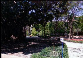
B_PARQUE EN CALLE DE LA INDUSTRIA