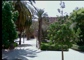
C_PARQUE EN CALLE DE ISLAS CANARIAS