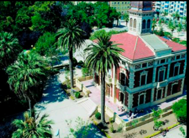
A_PARQUE DE AYORA

ESTUDIANDO LOS ESPACIOS VERDES SITUADOS EN UN ENTORNO PRÓXIMO A NUESTRO LUGAR DE ACTUACIÓN: