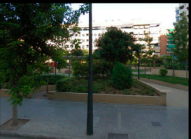
D_PARQUE EN CALLE PADRE TOMÁS MONTAÑANA