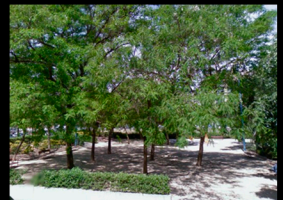
E_PARQUE EN CALLE LEBÓN