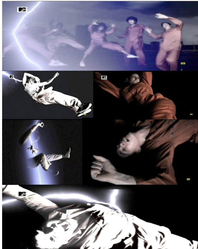
Ilustración 1 Minuto 06:10 Cae el rayo

El ataque a Gary (Min. 09:30) es el tercer evento importante del capítulo porque es donde se corrobora que a Tony le sucede algo extraño, junto con la escena en la que Kelly oye los pensamientos, la sospecha de que la tormenta ha tenido alguna influencia sobre los personajes se convierte en una realidad. Es una escena con una alta carga de suspense y curiosidad.