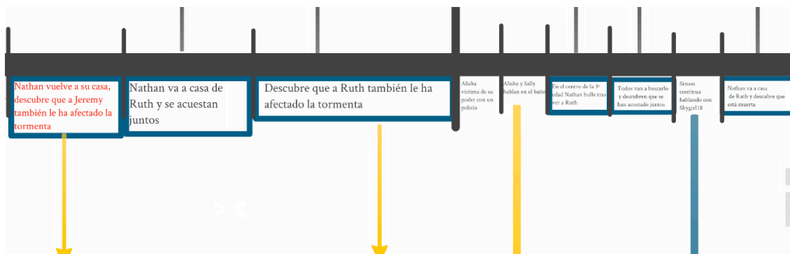
Ilustración 2 Captura de Pantalla del Prezi