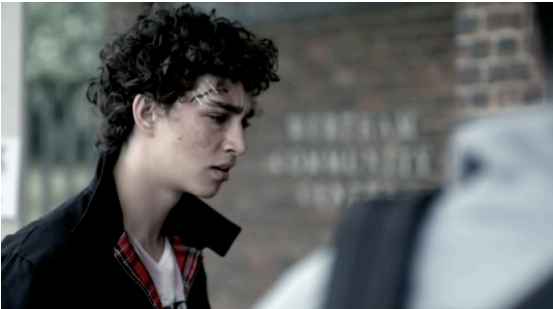
Ilustración 6 Minuto 35:46 Curtis descubre que Nathan es el único superviviente.

El segundo evento tiene lugar después de que Curtis haya cambiado el presente por segunda vez, cuando vuelve al centro cívico y se encuentra que todos están muertos excepto Nathan (Min. 35:30). Este momento es clave en la narración porque parece que Nathan haya sido el único superviviente de manera aleatoria, pero en realidad, en el último capítulo se desvela que su poder es que puede resucitar. A estas alturas de la historia, el espectador no es consciente de esta información, pero su aparición en el capítulo de manera totalmente inocente es una pista de la información que se revelará tiempo después.