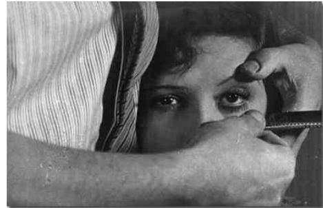
“Un chien andalou” (1929)

Luis Buñuel und Salvador Dalí erzählten sie sich im 1929 gegenseitig zwei ihrer Träume: Buñuels Traum soll eine langgezogene Wolke enthalten haben, die den Mond durchschneidet, „wie eine Rasierklinge ein Auge“ zerschneidet, und Dalís Traum eine Hand, die voller Ameisen war. Von diesen zwei Träumen Buñuel regied “Un chien andalou” ein Kurzfilm gilt als Meisterwerk des surrealistischen Films.