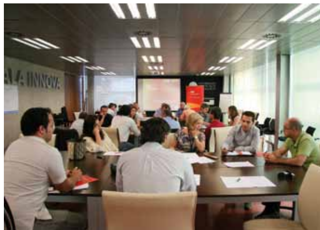
Figura 5. Sesiones de trabajo llevadas a cabo para el diagnóstico de las necesidades de la industria española del deporte. Grupo de trabajo de Gestión/Construcción de instalaciones deportivas.

A continuación, estas recomendaciones fueron tratadas a lo largo de un proceso de síntesis con el fin de seleccionar, mediante su priorización, las actuaciones que, desde una perspectiva de conjunto, conviene emprender para desarrollar el sector. Así, se han definido las acciones propuestas que componen la Agenda Estratégica de la Industria Española del Deporte.