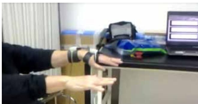
Figura 5. Prueba de registro del temblor con IMUs para validar ortesis.

90 grados respecto al suelo. El segundo movimiento consistió en elevar los brazos extendidos hasta llegar a una posición de 90 grados con respecto al suelo, partiendo en este caso de una posición de reposo. Para recoger todos estos movimientos se situaron dos sensores inerciales (IMUs) en el brazo a evaluar, uno de ellos en la línea media de la superficie dorsal del antebrazo y el otro en el tercer metacarpiano (Figura 5).