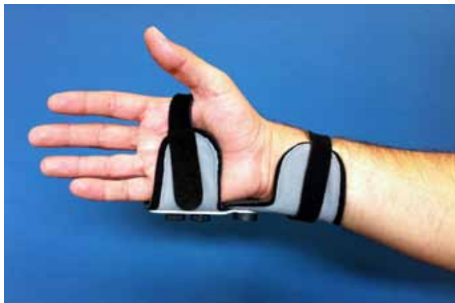
Figura 3. Prototipo realizado para las pruebas con pacientes.

rolló prototipos de ortesis que transformarían los prototipos funcionales del IBV en diseños más cercanos a la realidad del mercado ortoprotésico (Figura 3). De hecho, se realizaron diversas evoluciones del diseño hasta que se consiguió un producto que cubriese de forma óptima los requerimientos definidos.