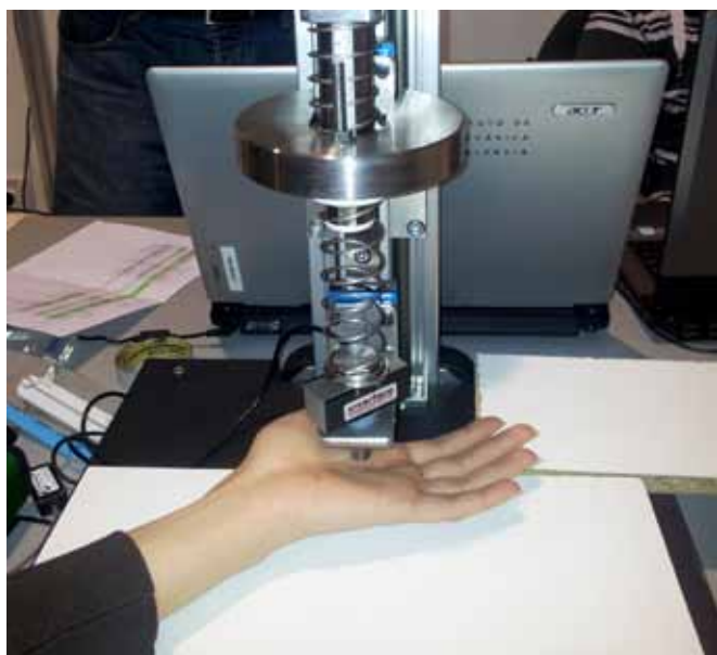
Figura 1. Caracterización de los tejidos blandos cercanos a la muñeca.

permitía evaluar el efecto de los distintos diseños de amortiguadores en función de la severidad del temblor.