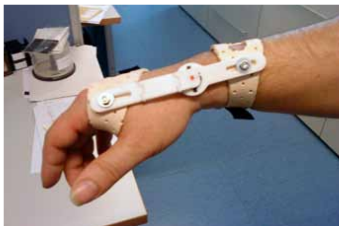
Figura 2. Prototipo preliminar de la ortesis.

Una vez identificados los requerimientos de la ortesis, comenzó el diseño de la misma. Inicialmente, el IBV desarrolló un primer prototipo de ortesis con amortiguadores comerciales para realizar algunas pruebas de concepto que validasen su diseño (Figura 2). Tras comprobar que los resultados preliminares de estas pruebas eran aceptables, la empresa EMO desa-