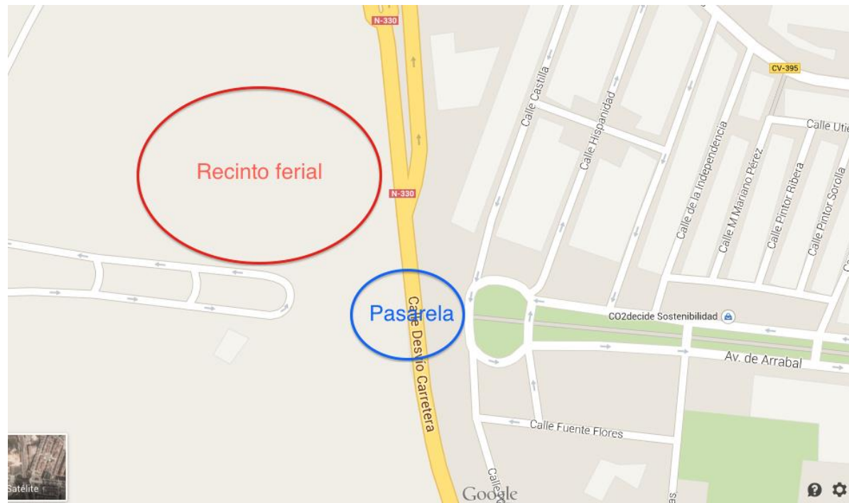
Figura 1. Emplazamiento de la pasarela

El objeto del presente trabajo es realizar una proposición de ideas para la ejecución de una pasarela peatonal en el núcleo urbano de Requena (Valencia) que cruce la carretera nacional N-III, y que comunicará el paseo del Arrabal con el futuro recinto ferial. También es objeto de trabajo realizar una elección de la solución más adecuada de todas las propuestas según los criterios que se señalarán y desarrollarla completamente hasta el punto que se requiere en un proyecto básico.