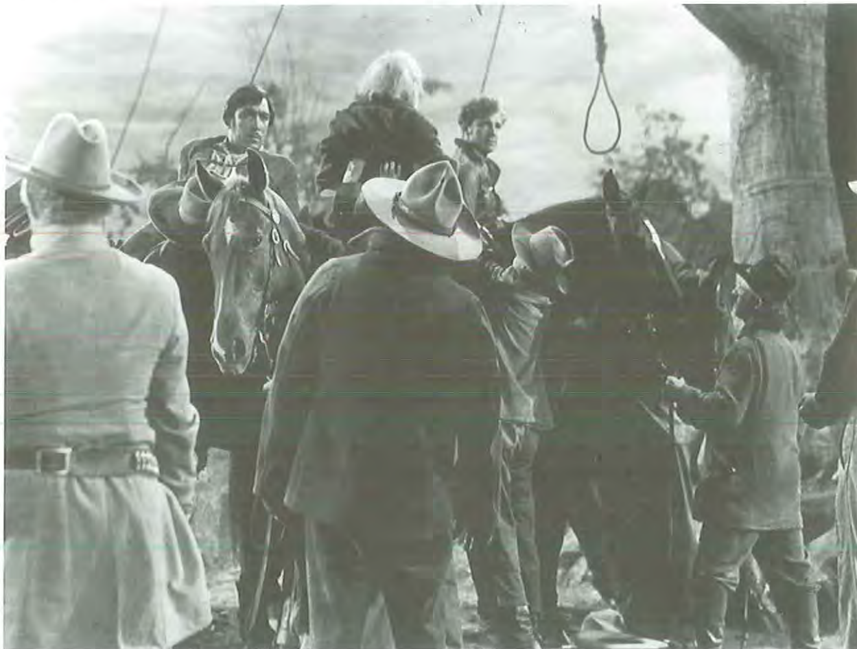
The Ox-Bow Incident

darse y Fonda abandona la ciudad. El asesinato legalizado, la justicia que no conoce de procesos sumariales ni de abogados y fiscales, dio pie a una de las mejores pel1culas del g3nero.