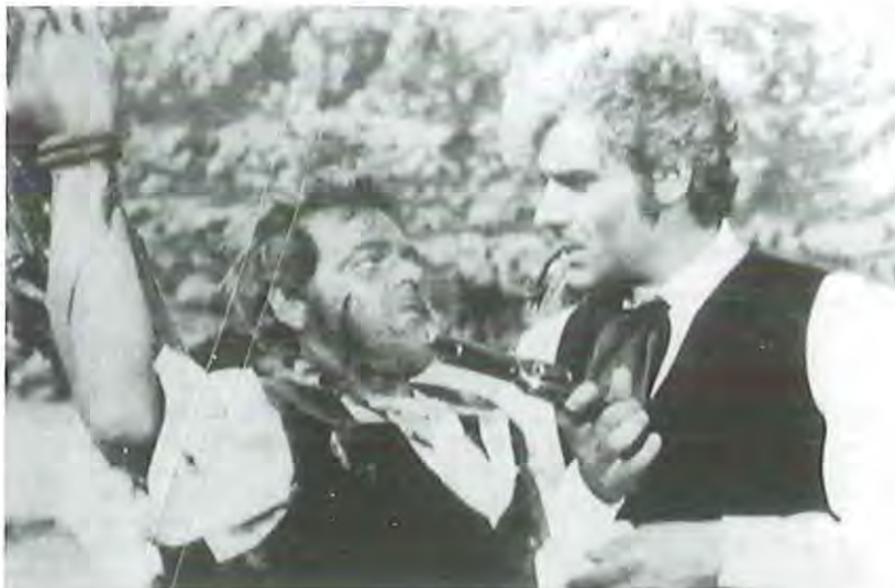
Cara a cara

En medio de ese estruendo de gritos y acciones violentas, la estructura del drama resulta intelectual y calculada, es decir, imprevisible. "Cuchillo" Sánchez no es un personaje tan neutro como parece a simple vista: su individualismo se manifiesta mediante su amor a la libertad y su apolítico odio, amén de burlesco desprecio, hacia representantes del gobierno, oficiales de la ley, revolucionarios, bandidos, pistoleros y moralistas. Es decir, hacia cualquier forma de restricción, de opresión. No en vano, su imagen siempre a caballo, galopando despreocupadamente sin rumbo fijo -mientras grita " ¡¡Cuchillo se vaaaaa!! "-, unida a sus miradas llenas de ironía o sus insolentes risotadas, se convierten en la exacta representación visual de ese sentimiento... "Cuchillo" no persigue en su vida