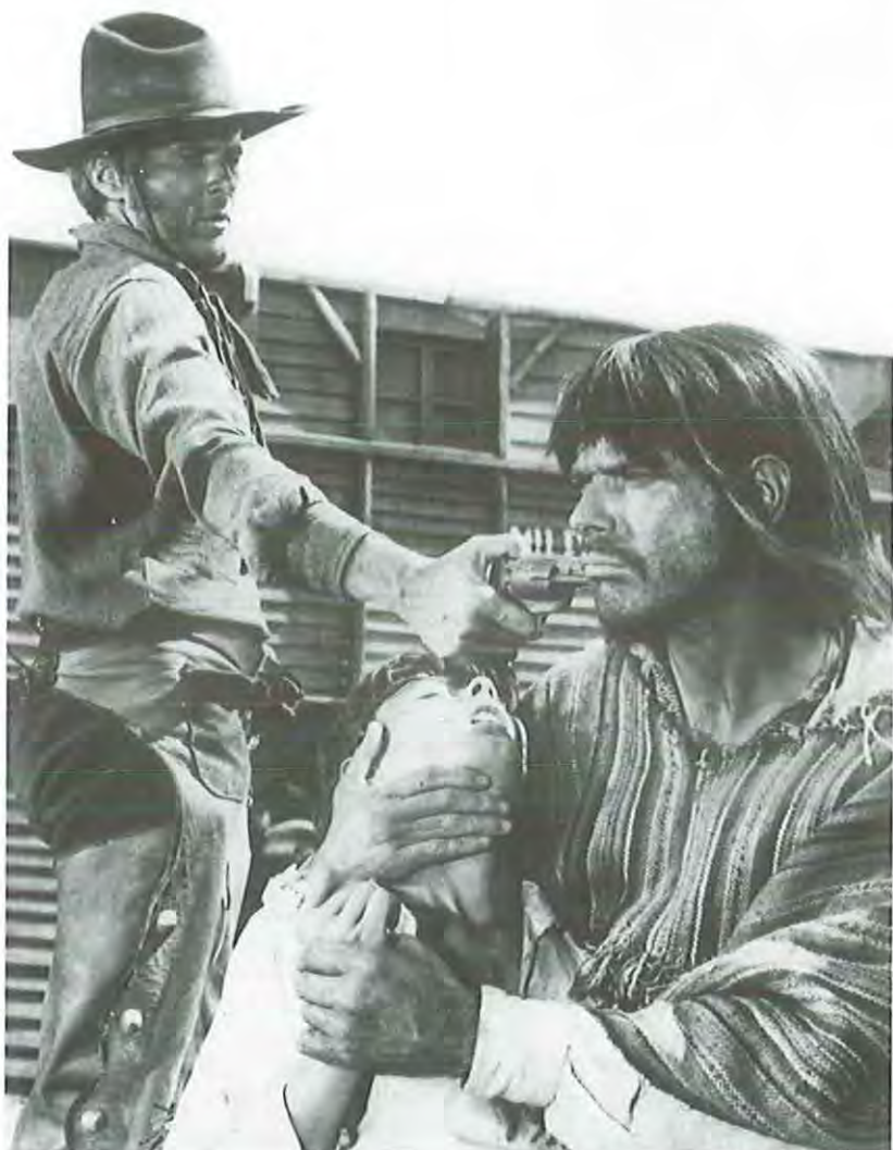
Cara a cara

"En los westerns detesto a los buenos y adoro a los malos, que son siempre menos perversos que los primeros. En aquella época, en la América de trenes y ferrocarriles, de civilización y progreso, de genocidios codificados y legalizados, convivían civilización y barbarie. Existían tipos poderosos