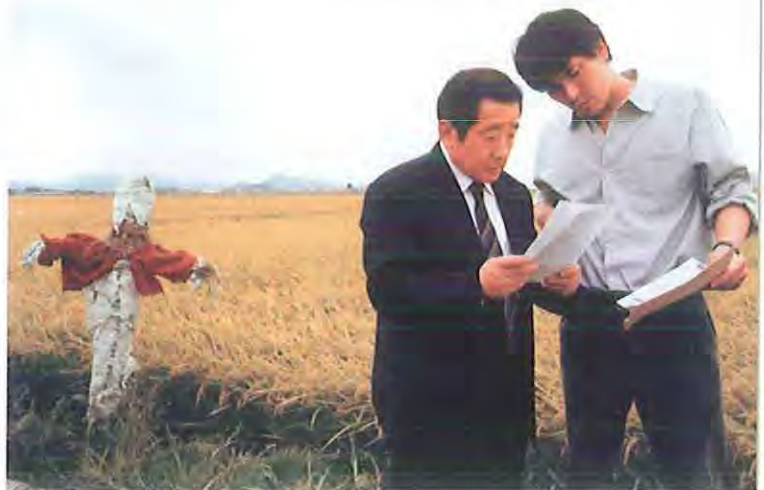
Memories of Murder: Crónica de un asesino en serie

posibilismo y carencia de recursos. Basada en un caso real, filtrado a través de una obra de teatro de Kim Kwang-rim, Memories of Murder: Crónica de un asesino en serie narra los viajes interiores (en direcciones opuestas) del degradado y pueblerino Park Doo-man y del civilizado, cultivado y prudente detective de Seúl Seo Tae-yoon, enviado desde la capital para ayudar en un caso de perfiles inéditos en la historia criminal coreana: Doo-man alcanza la redención en el mismo instante en que Tae-yoon acaba de cruzar esa línea de sombra que, quizás, le ha permitido comprender en algo a su embrutecido colega. La película revela a Bong Joon-ho como respetable representante de lo que podríamos llamar el "cineasta de laboratorio": cachorro cinéfilo formado en escuela de cine e incapacitado para la narra-