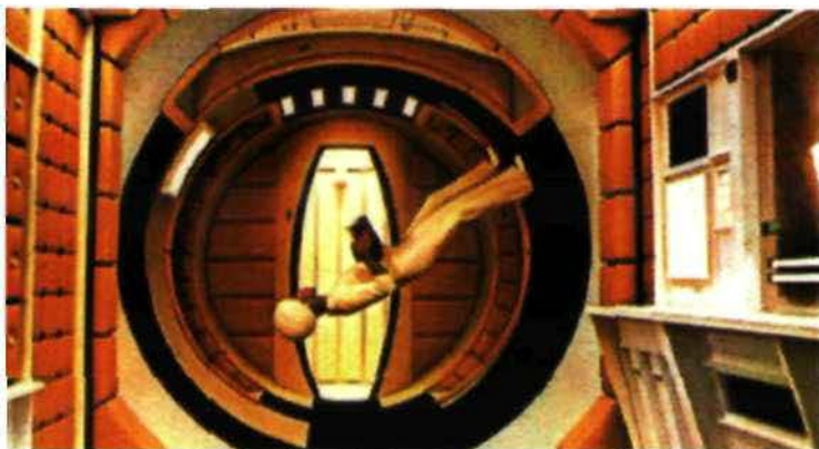
2001: una odisea del espacio

jugada. El ajedrez te entrena para pensar antes de capturar una pieza, así como para detectar objetivamente cuando estás en peligro. Cuando estás rodando una película tienes que tomar gran parte de las decisiones sobre la marcha, y siempre hay una tendencia a rodar precipitadamente. Tomar decisiones en apenas treinta se-