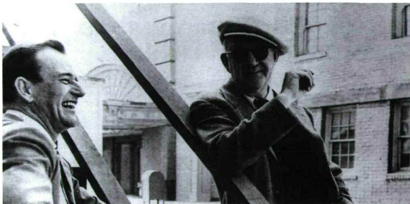
John Ford junto a John Wayne

una joven granjera. Cheyenne Harry es el primer héroe conflictivo de Ford, iniciador de una larga galería de seres profundamente heridos cuyas hazañas, o bien no serán reconocidas como tales o, en todo caso, servirán para confirmarlos en su estatuto errático y desolado. El teniente Rusty Ryan, obligado a sacrificar su objeto de deseo en aras de la obediencia al reglamento militar en They Were Expendable (1945), Ethan Edwards, excluido de un orden familiar que ha contribuido a restaurar desde el horror de sus propias laceraciones internas en Centauros del desierto ("The Searchers", 1956) y Tom Doniphon, artifice no acreditado de la empresa civilizatoria del salvaje Oeste en El hombre que mató a Liberty Valance ("The Man Who Shot Liberty Valance", 1962) —los tres personajes encarnados por John Wayne— son buen ejemplo de la estirpe de perdedores a la que, con tanta calidez, se aproximó el realizador de Cape Elizabeth.