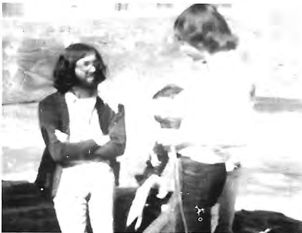
Ateneus, 1978, Video-Nou

-Al día siguiente, grabamos una de las últimas casas bajas que quedan de la antigua población, resistiendo hasta el último momento; en la fuente de Canyelles, y desde la montaña, una vista general descriptiva del nuevo polígono.