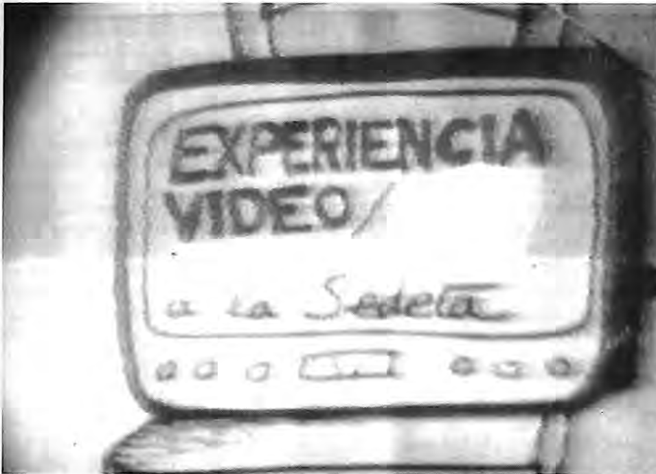
Ateneus, 1978, Video-Nou