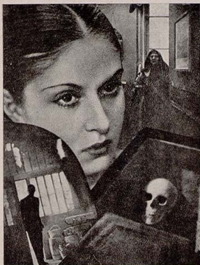
«La extraña aventura de David Greys, film mudo de Dreyer sincronizado y presentado con el título de «El vampiro».