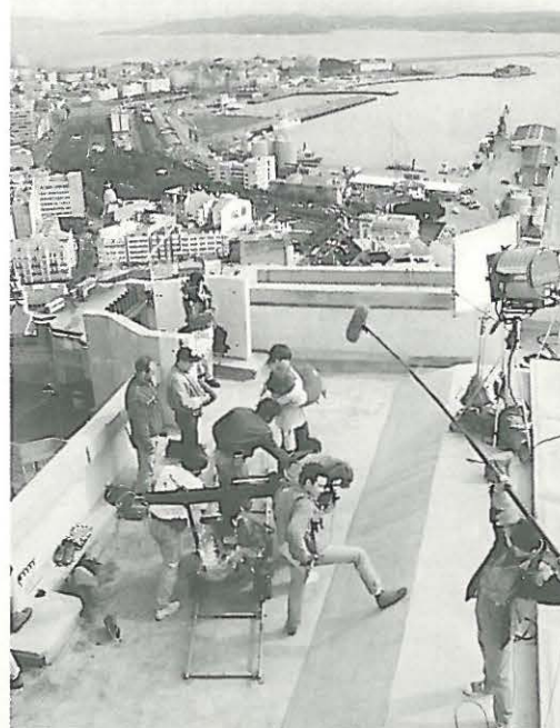
Rodaxe de DAME LUME na Coruña.