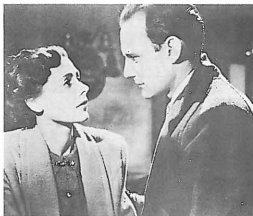
Nesta páxina e na anterior: tres fotogramas de BRIEF ENCOUNTER.

O rizo que se establece sobre a secuencia que abre o filme, a despedida de Alec e Lau-