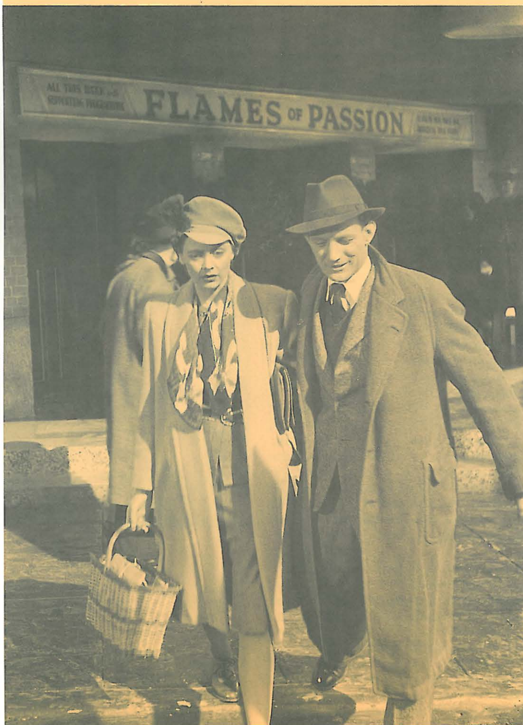
Celia Johnson e Trevor Howard en BRIEF ENCOUNTER (1945)

Alguén dixo que quizá BRIEF ENCOUNTER non sexa a mellor das películas británicas (aí está, molestando, Michael Powell), pero que non cabe dúbida de que é a máis británica das películas. O seu carácter emblemático procede do acerto con que sir Noël Coward e sir David Lean retrataron o modo de vida británico e a súa capacidade para frustrar unha apaixonada historia de amor, para negar toda paixón.