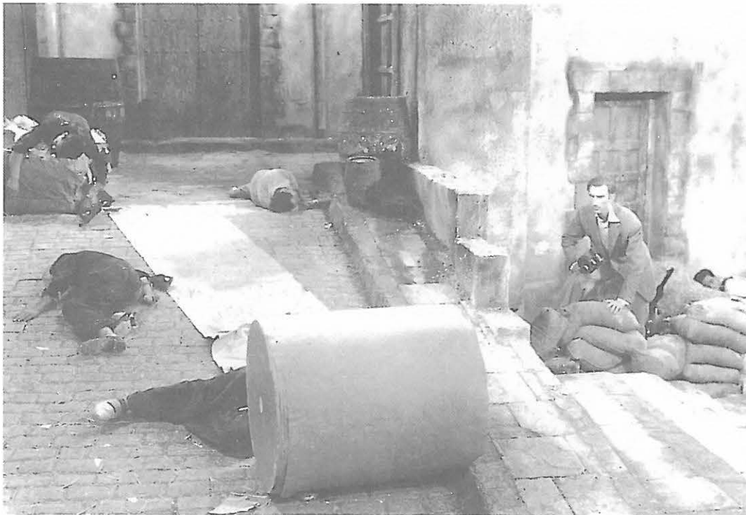
Fotograma de VIDA EN SOMBRAS (1948)

te básico sobre el futuro de la autorrepresentación del cine entendido como tal, un paso más allá de la simple exhibición manierista, UN ESPÍA EN HOLLYWOOD va mucho más lejos y se centra ya inequívocamente en el propio dispositivo fílmico: ya no se pregunta si el cine puede descubrirnos la realidad, es decir, si es capaz de redimirnos del infierno de nuestra conflictivas relaciones con el mundo, sino simplemente si puede reflejar esa realidad, y si ese reflejo, a su vez, puede conducirnos a la esencia, no ya de nosotros mismos, sino de las propias cosas.