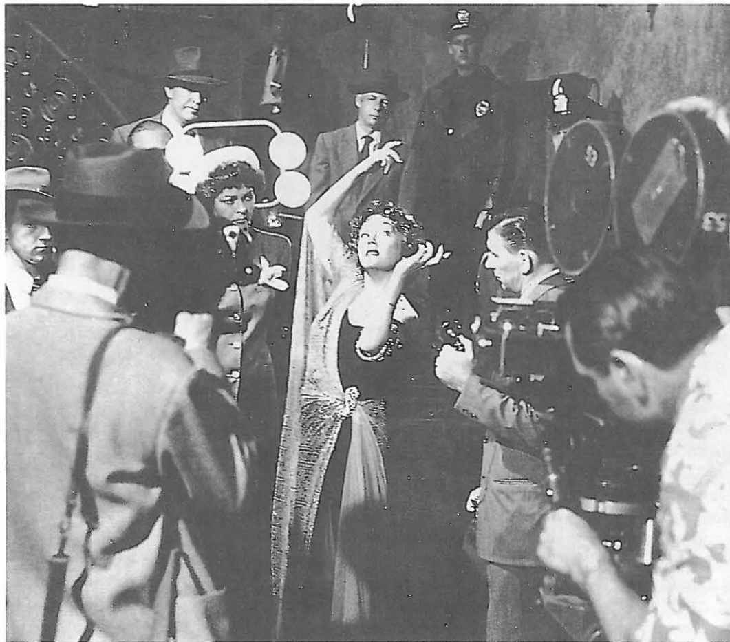
Gloria Swanson en EL CREPUSCULO DE LOS DIOS (1950)

vería así paralizada la autoindagación sobre su propia naturaleza por culpa de un reflejo casi narcisista: aquel que le llevaría a hablar continuamente de sí mismo sin en realidad hablar de lo que terminaría siendo únicamente pura e improductiva tautología.