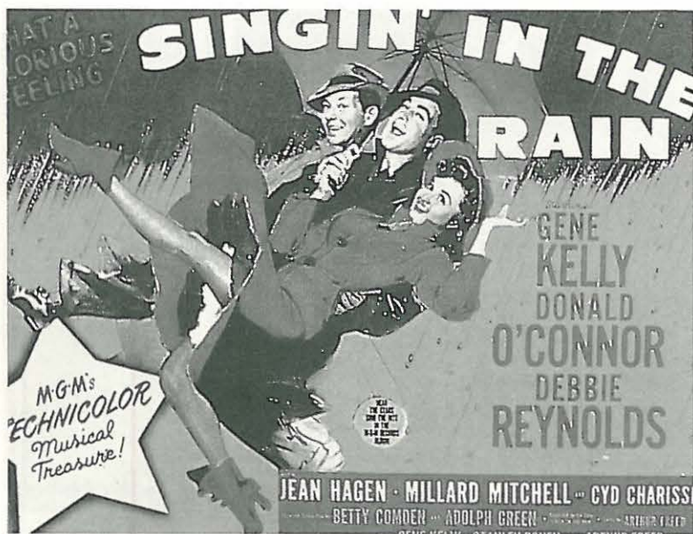
Cartel de CANTANDO BAJO LA LLUVIA (1952)

Actuando como metáfora de una existencia condenada al desamparo y a la muerte, los destinos de estos personajes se desarrollarían así en el marco de un mundo engañoso y cruel en el que nada es lo que parece. Y la ideología resultante ostentaría el estandarte de un idealismo acumulativo en el que el juego de espejos se multiplicaría hasta el infinito. El fenómeno del cine dentro del cine