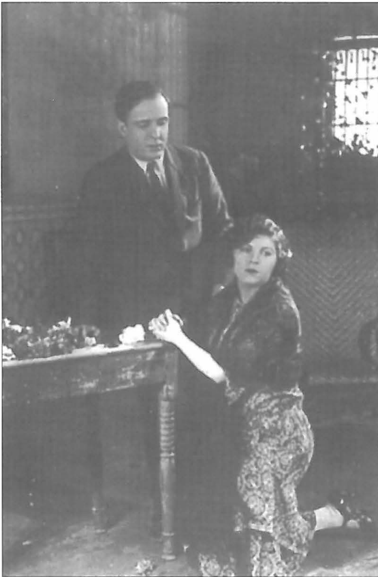
MALVALOCA [1926] de Benito Perojo

ló un equipo portátil —aunque en este caso era un Visatone de la Marconi's Wireless Company Ltd.—, que generó los graves problemas de sonido que padecieron EL NOVIO DE MAMA (1934) y LA HERMANA SAN SULPICIO (1935), dos películas de Florián Rey allí rodadas. El tercer gran estudio del momento, CEA, era el único que tenía instalado un sistema que ofrecía una reconocida solvencia, un Tobis Klangfilm. De hecho, en una fecha tan tardía como mayo de 1936, en el primer número de Película —un intento de revista corporativa que no prosperó— se afirmaba en un apartado dedicado a los aspirantes a guionistas: "En España, los guionistas deben evitar en lo posible las