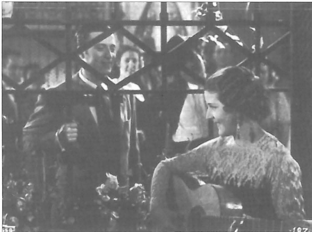
LA HERMANA SAN SULPICIO [1934] de Florian Rey

impulso para la cinematografía sonora española en un momento en que comenzaba uno de los periodos más duros para la producción del país: pero las condiciones en que se produjo y el hecho de que ya de partida tuviese una muy difícil carrera comercial, dieron al traste con el proyecto. A todo ello se debe añadir el problema de la concepción de cine sonoro que se manejó para su realización, más allá de los referentes evidentes que ya han sido citados. En realidad, EL MISTERIO DE LA PUERTA DEL SOL en ningún momento deja de ser una película muda en la que aparecieran sincronizados algunos sonidos de escenas de la vida cotidiana, se recitan algunos diálogos, que bien podían ser intertítulos (el hecho de que en un momento de conversación en el que había ciertos problemas de sonido se intercalase un intertítulo con las frases de los personajes pone en evidencia esa subsidiaridad de los diá-