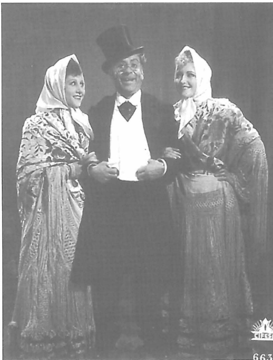
LA VERBENA DE LA PALOMA [1935] de Benito Perojo