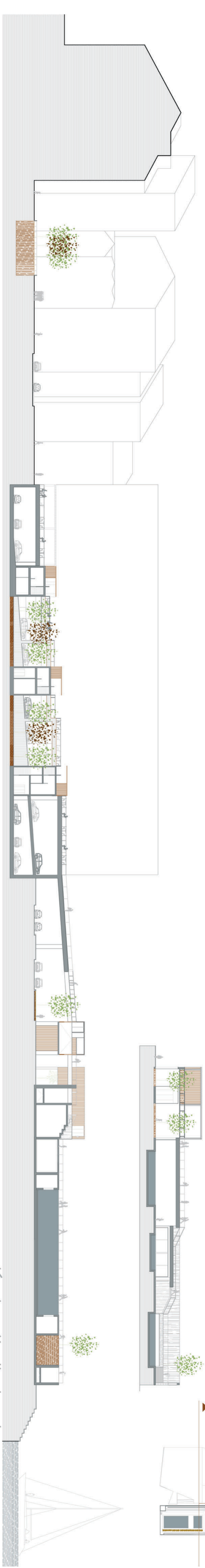
sección longitudinal este e 1:400