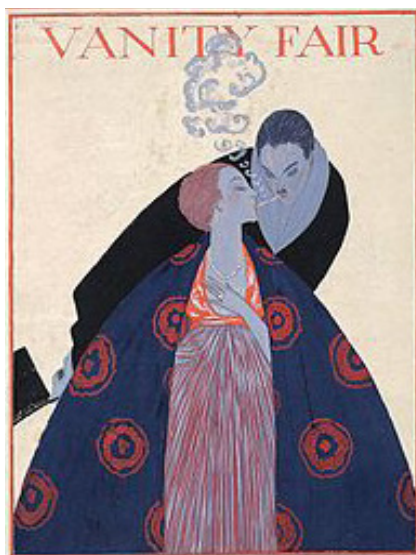
1. Georges Lepape, 1912 27,9 cm X 18,4 cm