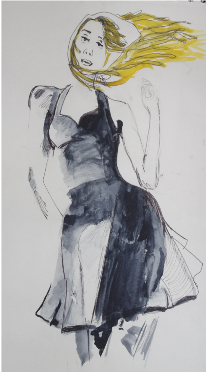
28. Ilustración en proceso. Acuarela sobre papel. 21x 15 cm. Anne-lise Barbier 2014

porque es anterior a la Helvetica .Así le daba un orden cronológico. A partir del artículo sobre los 50 ya se ve el uso de esta tipografía ya que aparece en dichas décadas.