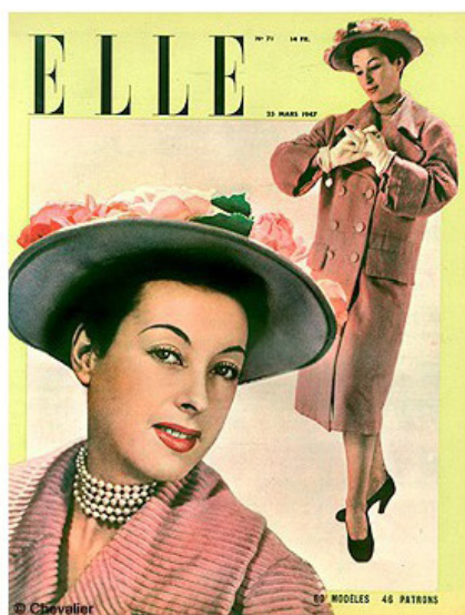
9. Vestido corte bias. Inspirado en los años 30. Anne-lise Barbier. Ilustración. 2014. acuarela, y retoque digital. 10. Portada revista “Elle”. Marzo 1947

No es hasta 1947 , dos años tras finalizar la guerra, cuando resurgirá la alta costura con los diseños de este nuevo y atrevido diseñador. Faldas a 30 cm del suelo, siluetas marcadas que resaltaban el pecho, faldas llamadas de bailarina, es el llamado “New Look” de Dior. Para confeccionar los nuevos vestidos se necesitaban grandes cantidades de tela, esto encarecía mucho el precio comparado con años anteriores. Este sería el gran comienzo en la