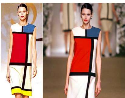
13. Vestido camisero. Inspirado en Mondrian. YSL 1961.

En esta década se van viendo muchos estilos de mujer diferente. Los Hippies, los Skinheads, las que seguían la moda más glamourosa, las mods . Los materiales eran cada vez más inverosímiles. El plástico y el PVC se empiezan a utilizar para confeccionar prendas y son una gran propuesta que agradó por