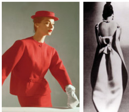
11. Traje de Christian Dior de 1947.