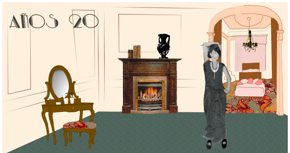
25. Primeros rótulos para libro catálogo. Anne-lise Barbier. 2014. Photoshop. 40x 20 cm a doble página.