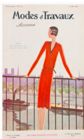
6. Art Goût Beauté. Julio 1924.