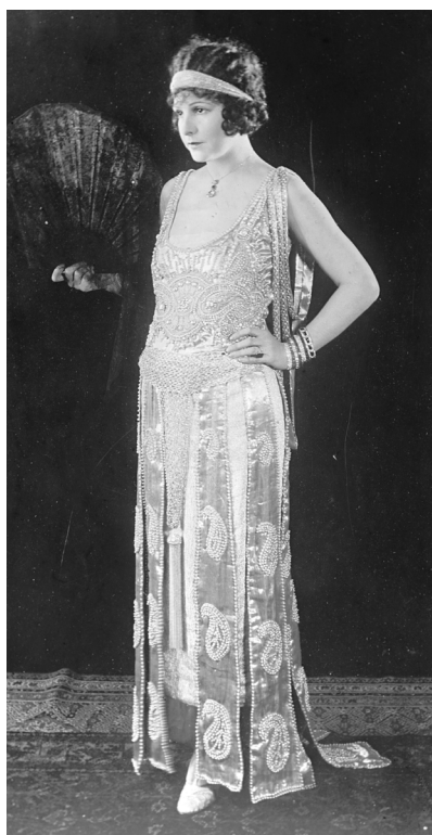
4. Coco Chanel, creadora del estilo "Garçonne."