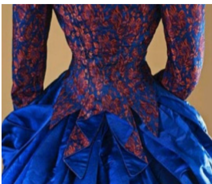
3. Diseños de Frederick Worth.