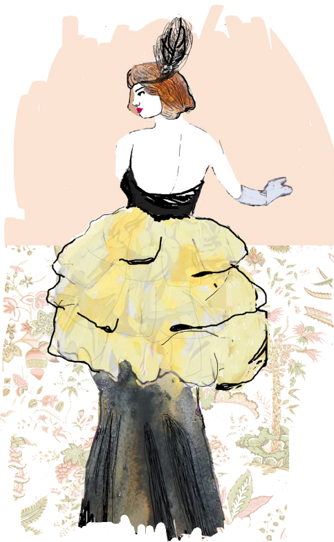
26. Ilustración Años de Glamour. Anne-lise Barbier. Acuarela y Photoshop. 2014

4.2.2.4 Contenido de la revista. Es donde se encuentran las ilustraciones con sus respectivos textos, donde aparece una breve introduc-