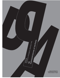
PROYECTO, PROGRESO, ARQUITECTURA N 02- SUPERPOSICIONES AL TERRITORIO (AÑO I, mayo 2010 - ed. conjunto N1)