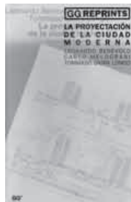
BIBLIOTECA TEXTOS VIVOS N 04 - PERMANENCIA Y ALTERACIÓN,

Jane Jacobs: MUERTE Y VIDA DE LAS GRANDES CIUDADES . Madrid: Ediciones Península, 1967.