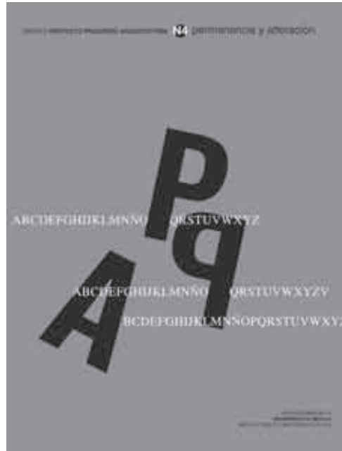
PROYECTO, PROGRESO, ARQUITECTURA N 04 - PERMANENCIA Y ALTERACIÓN (AÑO II, mayo 2011)