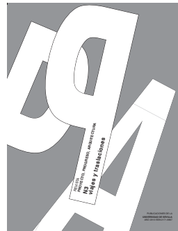
PROYECTO, PROGRESO, ARQUITECTURA N 03- VIAJES Y TRASLACIONES (AÑO I, noviembre 2010)