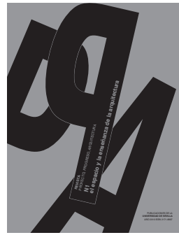
PROYECTO, PROGRESO, ARQUITECTURA N 01- EL ESPACIO Y LA ENSEÑANZA DE LA ARQUITECTURA (AÑO I, mayo 2010 - ed. conjunto N2)