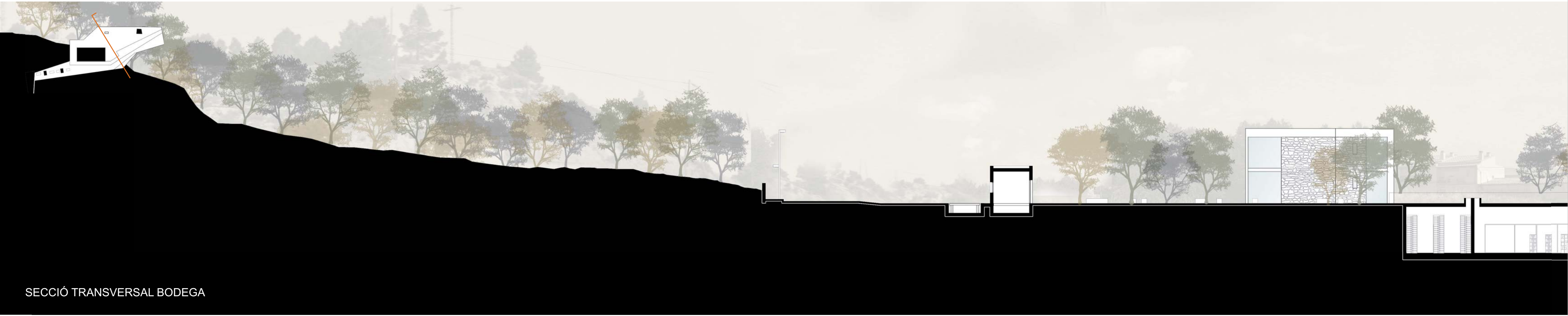
SECCIÓ TRANSVERSAL BODEGA