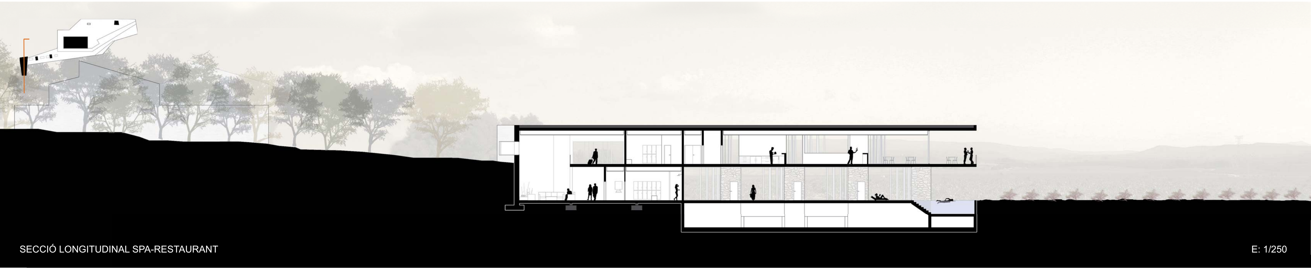
SECCIÓ LONGITUDINAL SPA-RESTAURANT