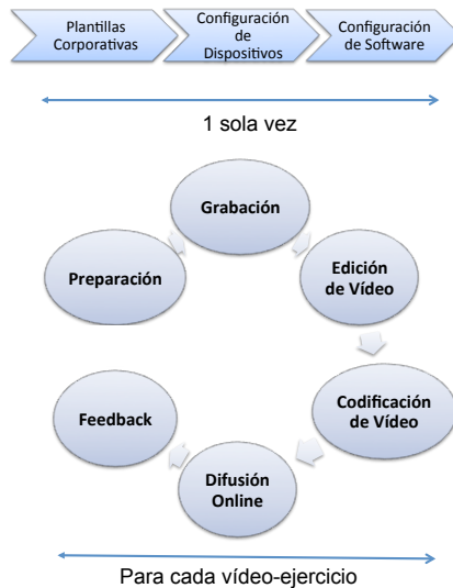
Figura 1: Diagrama de interacción para la creación y difusión de vídeo-ejercicios.