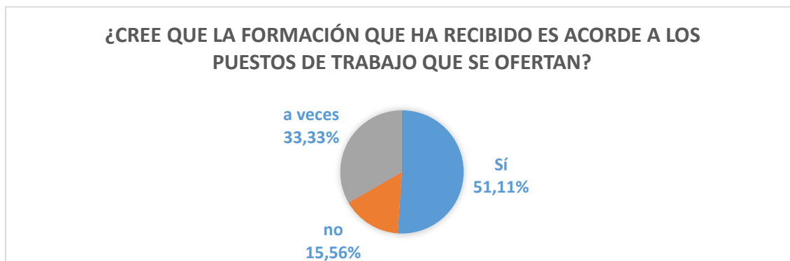
Gráfica: 3 ¿Cree que la formación que ha recibido es acorde a los puestos de trabajo que se ofertan?