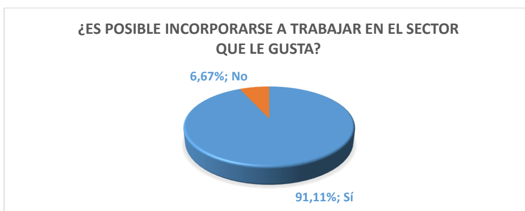
Gráfica: 2 ¿Es posible incorporarse a trabajar en el sector que le gusta?