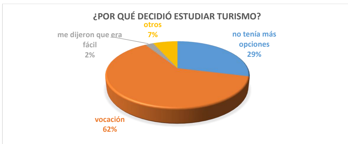
Gráfica: 1 ¿Por qué decidió estudiar turismo?

Fuente: Elaboración propia mediante los datos obtenido a través de las encuestas