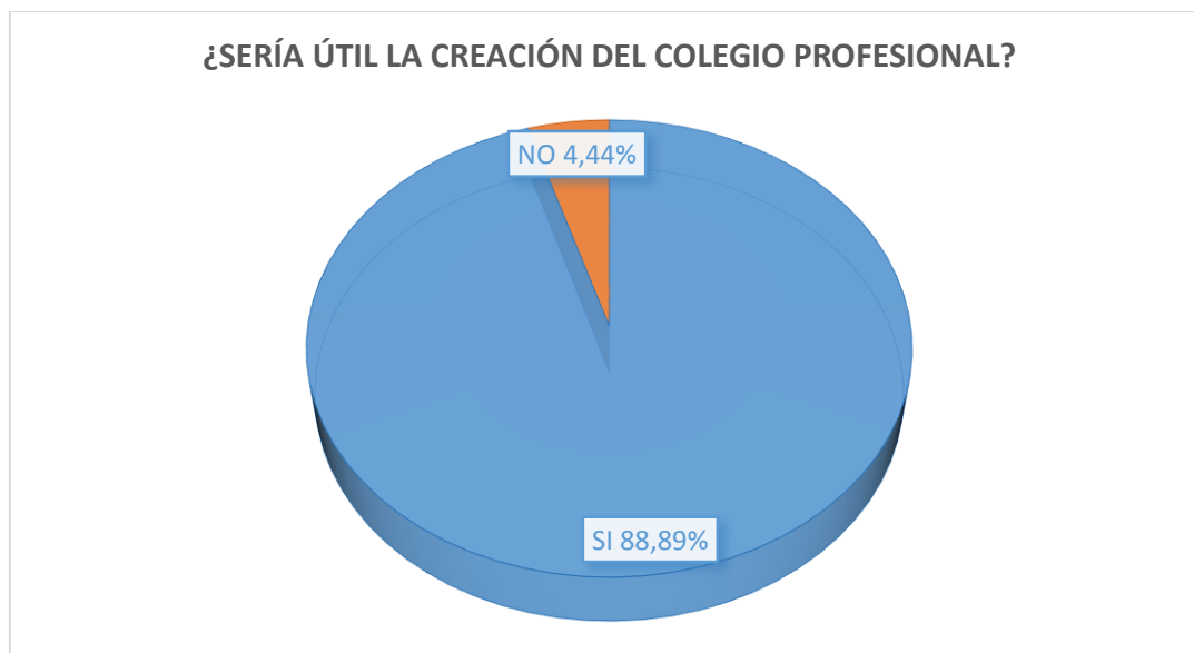
Gráfica: 5 ¿Cree que sería útil la creación del Colegio Profesional?