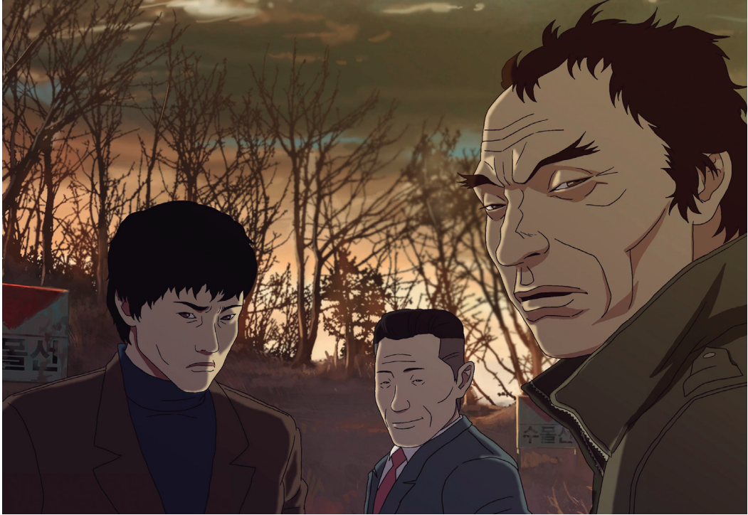
Fig. 5 – The Fake (Sang-ho Yeon, 2013). Premio al mejor largometraje, HAFF, 2014.