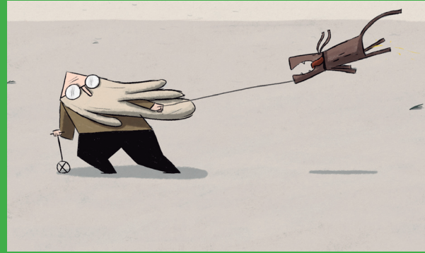
Fig. 7 – Wind (Robert Löbel, 2013). Premio al mejor cortometraje de estudiante europeo, HAFF, 2014.