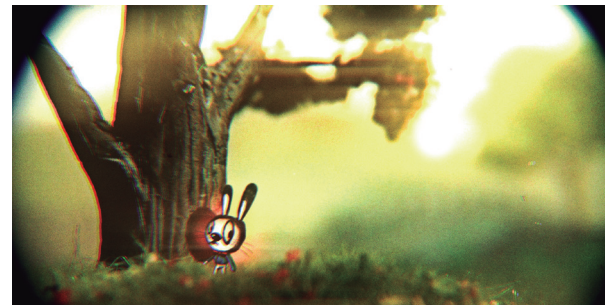
Fig. 6 – The Obvious Child (Stephen Irwin, 2013). Mención especial a cortometraje narrativo, HAFF, 2014.

Sí, pero la gente debe aprenderlo. Muchos realizadores aprenden, pero están solo interesados en hacer la película. Pero la producción es tan importante como hacer el film. Y si producen una película y están realmente involucrados, entenderán la producción. Como estudiante puedes hacer y decidir todo, pero después, tras la graduación, si quieres hacer una película de 5