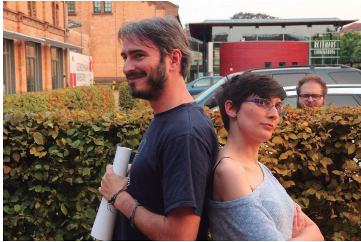
Fig. 6 – Compañeros concentrados en Studio SOI.