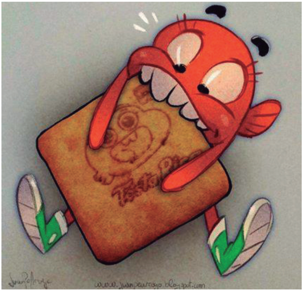
Fig. 5 – Darwin Watterson, co-protagonista de la serie The Amazing World of Gumball . Ilustración de Juan Pedro Arroyo.

sitar durante la escena. Esta distribución en símbolos nos permite reutilizar y generar con facilidad modificaciones de elementos ya existentes, dando una gran solidez a los personajes y conservando el fuerte carácter de diseño que define la serie.