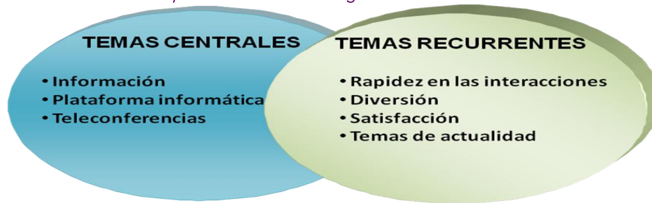
FIGURA 2. Temas centrales y recurrentes de la categoría de análisis simulación telemática

En resumen, pese a que, en general, los sujetos de GE1 y GE2 encuentran relevantes los temas tratados, también opinan que se debe mejorar la dinámica de las teleconferencias. Según se puede observar en sus apreciaciones, la rapidez del sistema de teleconferencias perjudica la toma de decisiones al momento y causa estrés y ansiedad. También queda de manifiesto que uno de los puntos que mayor controversia genera es la cantidad de información que los sujetos deben manejar en la simulación telemática. "Mucha información y sin poder entender demasiado los conflictos. Esto se puede hacer más claro para los alumnos. No somos nativos la mayoría". Se puede concluir que, aunque existe la percepción de una necesidad de información dosificada y de la escasez de tiempo para procesarla durante las teleconferencias, hay que destacar que la población encuentra que la simulación telemática es una manera original de aprender inglés y nuevos temas de actualidad; además de adquirir un nivel superior de conocimientos de una lengua de forma interesante y divertida.