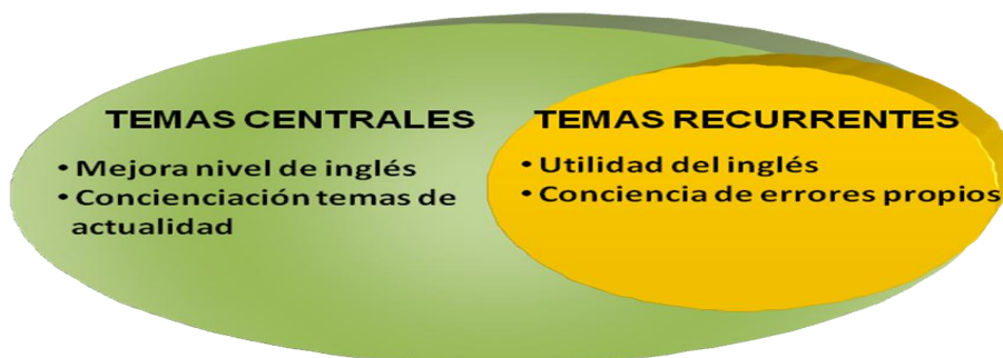
FIGURA 3 Temas centrales y recurrentes de la categoría de análisis cambio cognitivo .

Asimismo, gran parte de la población opina que este curso fomenta la autoconciencia al abordar temas de actualidad y reconoce tener mayor entendimiento y cambio de actitud sobre cuestiones actuales de interés mundial.