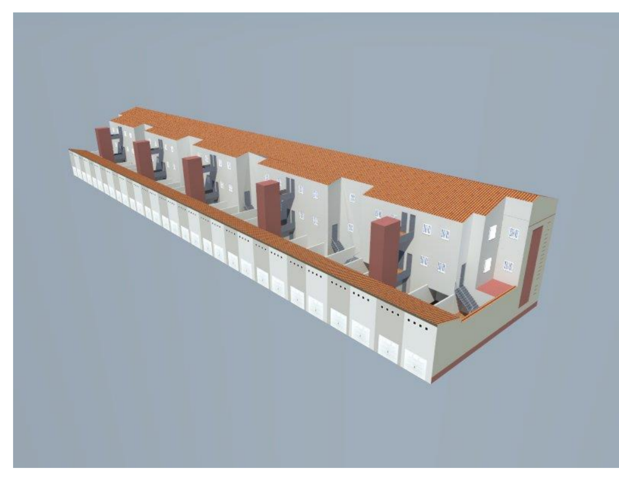
Perspectiva C/ Atardecer