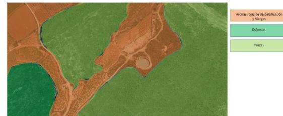
Foto 3. Geología de detalle

Estos materiales quedan reflejados en la Foto 1.