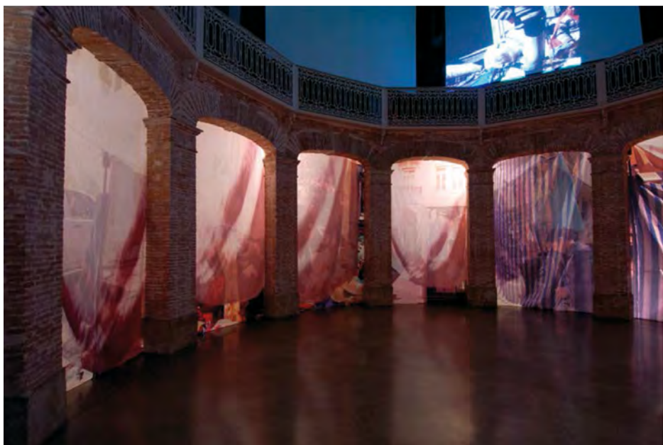
Figura 4. Instalación Nómadas y Devotas . Sala La Gallera, Valencia, 2006.

confluencias y actitudes, creando así escenografías donde la ficción plantea interrogantes en torno al binomio tiempo y espacio.