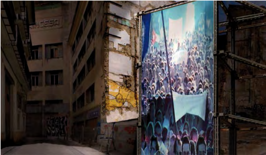
Figura 5. Serie Fusión y pasado , 2010. Fotografía. Impresión ink-jet papel ilfochrome. 87 × 100 cm.