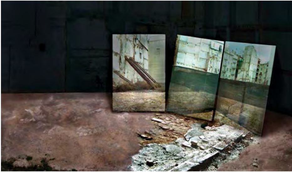
Figura 7. Serie Sueños de vuelta al origen , 2010. Fotografía. Impresión ink-jet papel ilfochrome. 87 × 100 cm.

Una vez realizadas las ampliaciones y montadas convenientemente las fotografías, los resultados son unas imágenes en color con una visualidad impactante y una poética basada en el interrogante sobre la escena que representa el acontecimiento urbano.