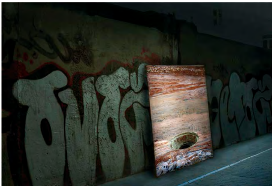
Figura 8. Serie Sueños de vuelta al origen , 2010. Fotografía. Impresión ink-jet papel ilfochrome. 87 × 100 cm.

que nos hablan de los movimientos que genera la actualidad y de la ciudad alterada por las acciones de sus habitantes. Como indica Manuel Castells (3): «Después de tanto hablado y escrito sobre la globalización urbana; después de asociarla a flujos planetarios, utopías tecnológicas y homogeneización mundial, resulta que lo que la ciudad y sus paisajes urbanos nos muestran hoy es, en realidad, la combinación de estas cualidades con la presencia, ubicua y continua, del pozo del lugar» (3).