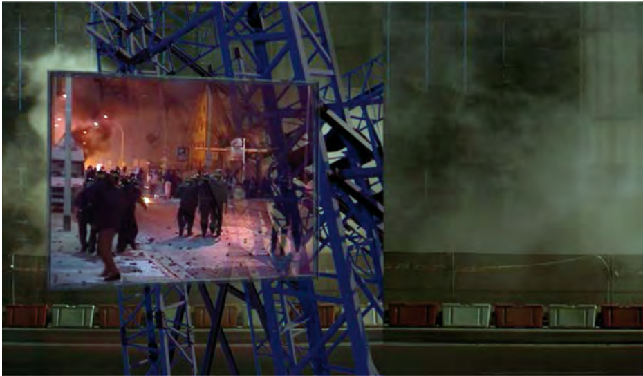
Figura 9. Serie Fusión y pasado , 2010. Fotografía. Impresión ink-jet papel ilfochrome. 115 × 200 cm.