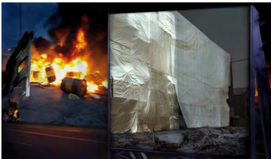
Figura 6. Serie Fusión y pasado , 2010. Fotografía. Impresión ink-jet papel ilfochrome. 87 × 100 cm.

A continuación, como primer paso, planteamos habitualmente un lienzo vacío donde se introducen las imágenes. En este momento es cuando se piensa verdaderamente la imagen en conjunto; la posible relación entre los datos y su significado. La secuencia de trabajo consiste en crear un escenario adecuado y después incorporar elementos, volúmenes que van construyendo la imagen ficticia.