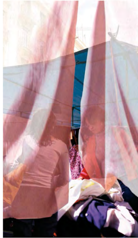
Figuras 2 y 3. Serie Nómadas y Devotas , 2006. Fotografía.

Nuestra intención, con el proyecto artístico que aquí se presenta, ha sido escenificar nuestra convivencia con la ciudad y esos paisajes y arquitecturas cambiantes que bien pueden ser el reflejo de otras tantas ciudades.