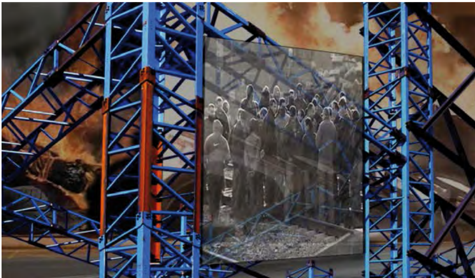
Figura 10. Serie Fusión y pasado , 2010. Fotografía. Impresión ink-jet papel ilfochrome. 115 × 200 cm.

Recibido: 26-06-2012. Aceptado: 08-10-2012.