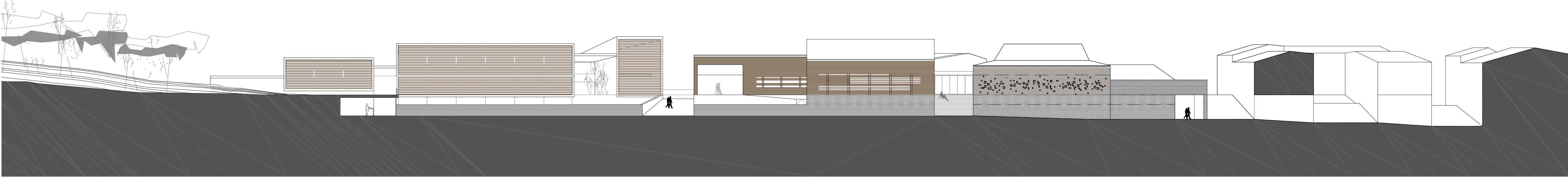
alzado calle interior e 1_300