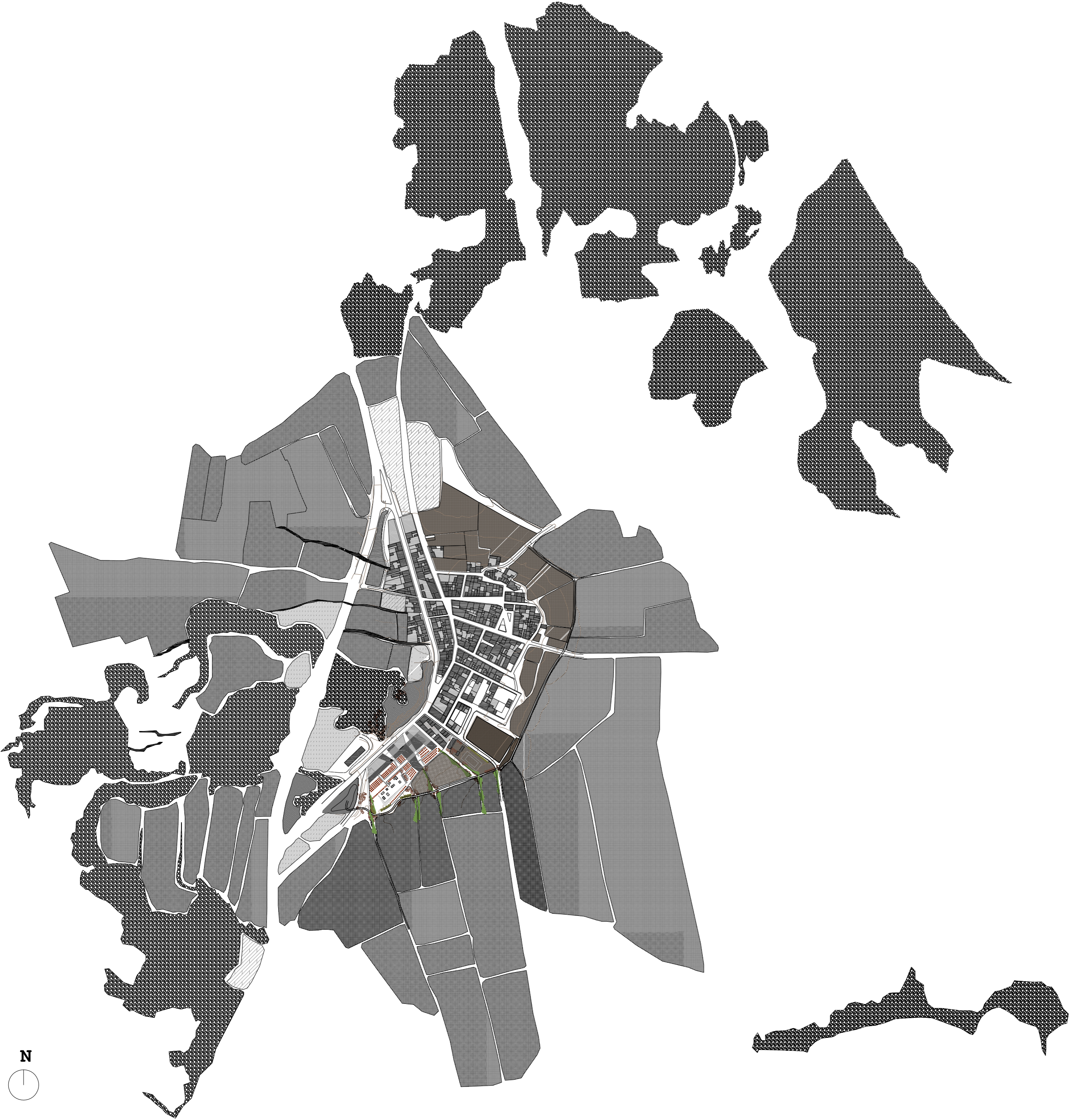
entorno e 1_5000