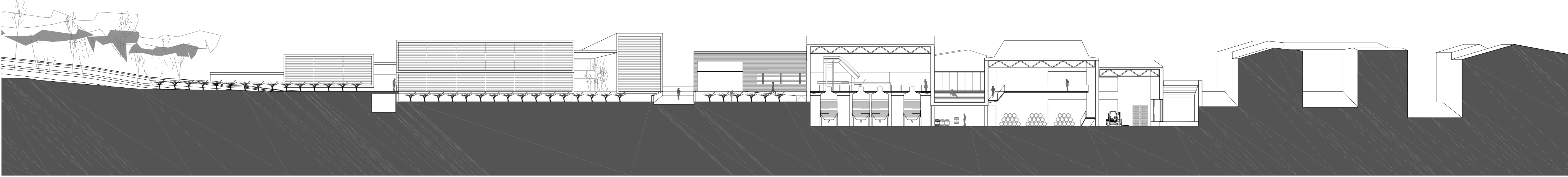
sección A e 1_300