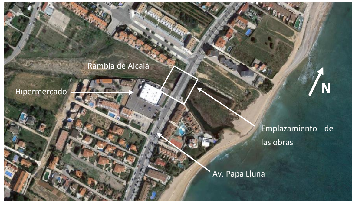
Figura 3 Emplazamiento de la actuación

Más concretamente, las obras se emplazan al sur del núcleo urbano, en la Avenida Papa Lluna a su paso sobre la zona de desembocadura de la Rambla de Alcalá.