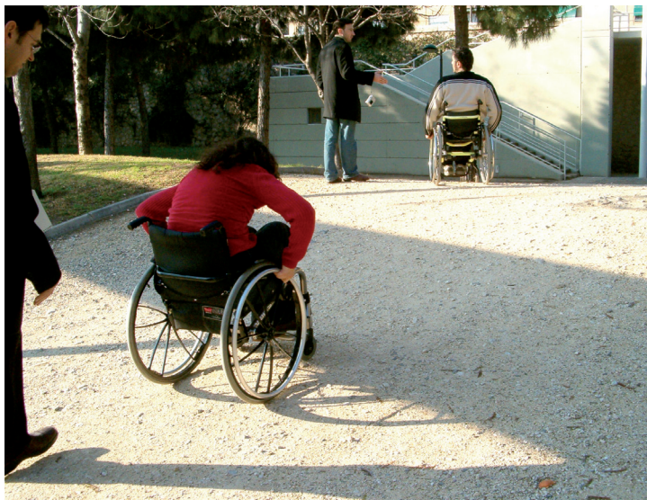
Jardí del Túria. Excessiva pendent

10. Conclusions. Per a finalitzar s'anomenen, de manera general, les deficiències detectades i els aspectes més rellevants en els quals cal insistir per a millorar-ne l'accessibilitat.