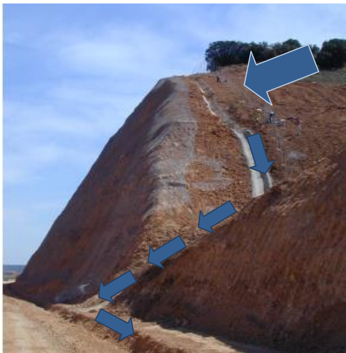
Figura 1.2. Cuneta de guarda y trayectoria del agua hasta la explanación

Las cunetas de guarda se colocan en la coronación de los desmontes. Sirven para captar las aguas que llegan a la vía férrea procedentes de terrenos más altos y su función principal es conducir dichas aguas hasta las cunetas de la explanación.