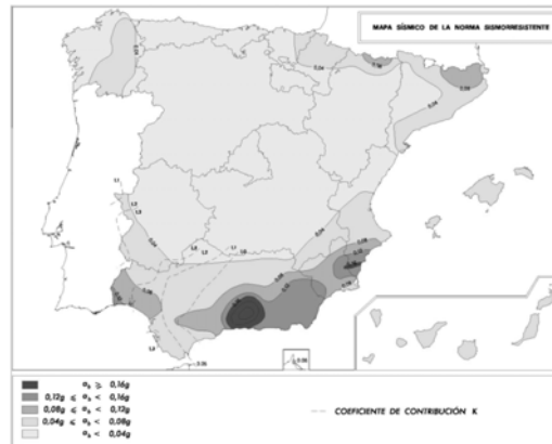
Figura 2. Mapa de peligrosidad sísmica (NCSE-02)

De este mapa (o del listado de municipios) se obtiene también el valor del coeficiente de contribución K=1