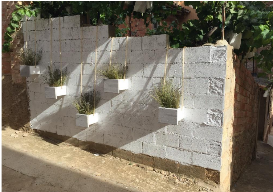
Imágenes de la intervención.

Para contener los manojos de lavanda se eligieron unas sencillas cajas de poliestireno expandido blancas, precisamente para potenciar el mayor protagonismo de estas flores. Las cajas se descolgaron de la parte superior del muro gracias a una doble cuerda, evocando vagamente la imagen de columpios suspendidos. En la cara frontal de cada caja, se aplicó una pintura grisácea irregular buscando combinar tanto con el tono morado de la lavanda como con la pintura de la fachada opuesta en la calle. Además, el tamaño de las cajas -similar al del bloque de hormigón- y el color aplicado en su frente aluden al estado previo de la fachada, antes de ser intervenida.