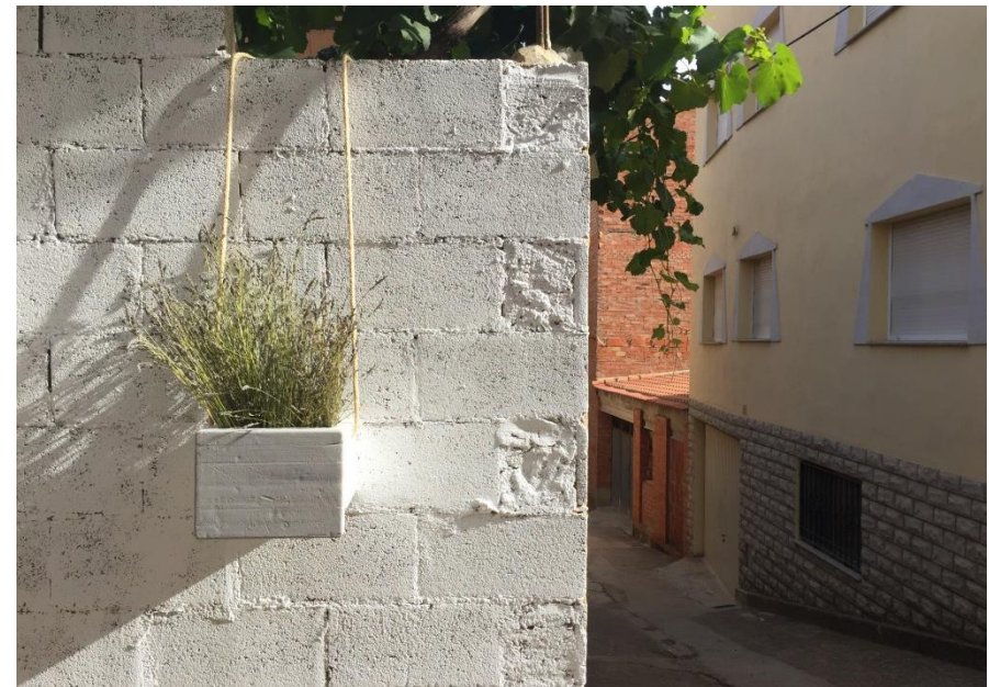
Imagen de la intervención.

Otro vínculo de conexión con el lugar -entendido en sentido amplio- se da con la elección de la flor de lavanda como ingrediente protagonista orgánico, una planta endémica en la zona que posee muy diversas propiedades ornamentales, desde sus formas estilizadas y amables hasta su peculiar aroma. La lavanda crece generalmente en estirados tallos con hojas muy pequeñas que evitan una gran evaporación de su agua interna, y acaban en una amalgama de pequeños capullos de flor violeta organizados de manera similar a las espigas del trigo. Estas flores poseen un delicado e intenso aroma muy apreciado por el ser humano, pues lleva siglos utilizándolo para elaborar esencias y aceites.