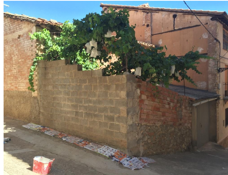
Preparación para pintar la intervención.