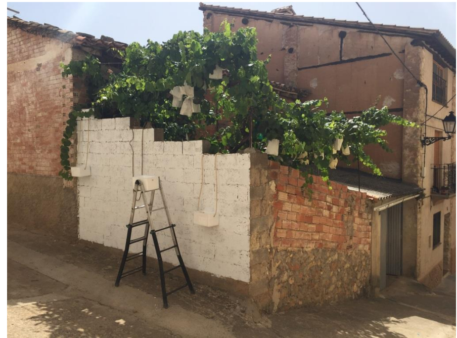
Colocación de las cajas.

_10_ Colocación de las tapas pintadas en el frente de las cajas.