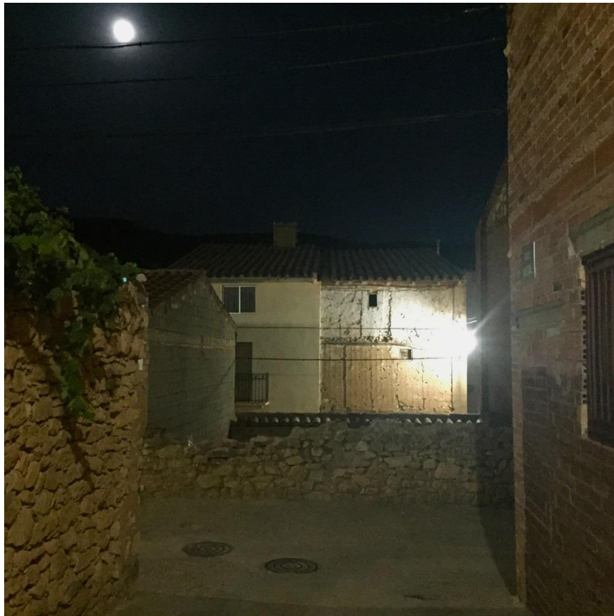
Imagen nocturna de una muestra de los acabados de las fachadas del municipio de Casas Bajas.

Como complemento a la recopilación de casos expuesta anteriormente, se propone la materialización de una experiencia artística propia con carácter efímero sobre un entorno urbano de ámbito rural, bien conocido por la autora por ser el lugar de origen de la familia materna.