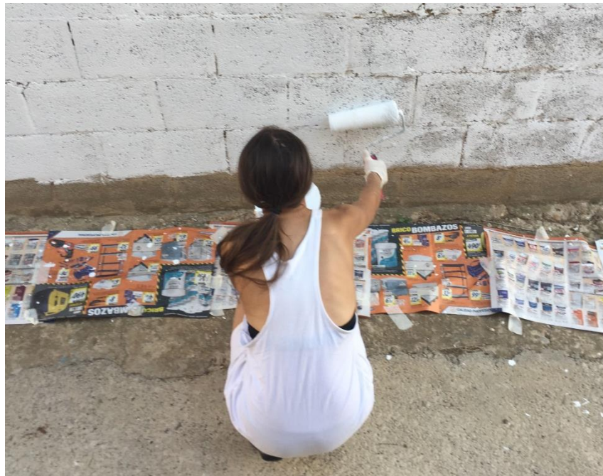
Aplicación de la pintura.

_7_ Colocación de piedras en el interior de las cajas a modo de contrapeso.