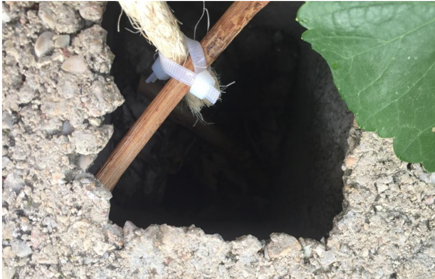
Detalle de la sujeción de las cuerdas en el muro.