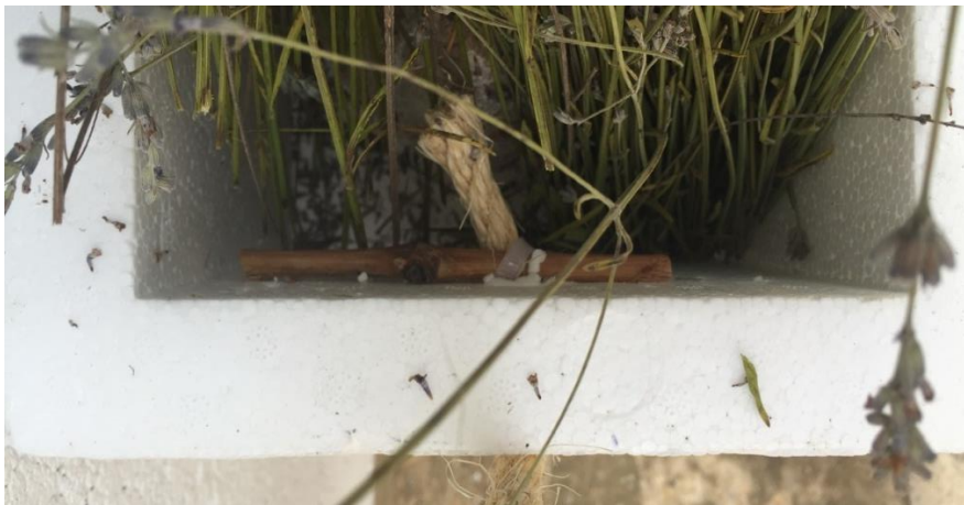
Detalle de la sujeción caja-cuerda.