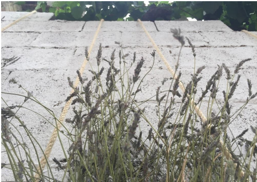
Lavanda en la intervención.

Se decidió cubrir el muro pintándolo en un tono blanco con el fin de proporcionar un fondo neutro conectado a su vez con la esencia tradicional del entorno. De hecho, este color dialoga perfectamente con la fachada encalada enfrentada al muro de actuación y con el basamento pintado en gris. La pintura blanca no llega a cubrir con totalidad los poros de los bloques de hormigón, lo que permite entrever la textura rugosa e irregular de la fábrica original.