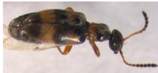
Figura 21. Especie sin identificar nº6. Vista dorsal.