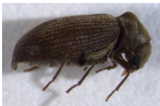
Figura 24. Anobium punctatum . Vista lateral.

Descripción: Tamaño de 2 a 5 mm de largo. Color marrón rojizo a marrón chocolate. Aspecto alargado, más o menos cilíndrica. Disposición de la cabeza mirando hacia abajo, la cabeza y la base de las antenas se encuentran completamente cubiertas por el pronoto. Antenas formadas por tres artejos. Pronoto es más estrecho que los élitros, con una fuerte protuberancia en la parte superior. Los élitros ligeramente estriados, con punteaduras grandes y profundas formando líneas regulares. Están cubiertos por una fina pubescencia amarillenta que se curva hacia atrás ( http://rains.es/guia-de-plagas/ ).