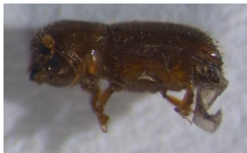
Figura 40. Pityophthorus . Vista lateral.

Descripción: las especies de este género su tamaño varía de 0'8 a 3'2 mm de longitud, cuerpo cilíndrico alargado, de color café oscuro, casi negro opaco. El macho tiene la frente convexa, y las hembras de cóncava a convexa, casi siempre con mechones de setas. Pronoto alargado, que cubre la cabeza (SÁNCHEZ et al. , 2006).