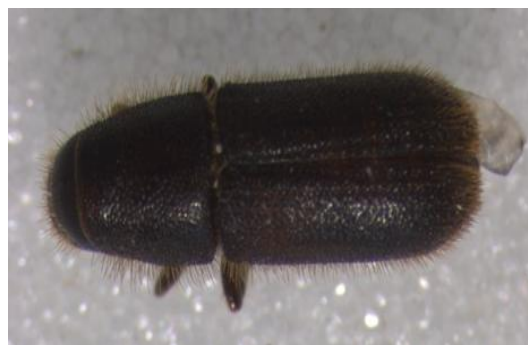
Figura 35. Hylurgus ligniperda . Vista dorsal.

Descripción: aspecto alargado y cilíndrico, con un tamaño de 4'5-5'8 mm. Pronoto y élitros de color marrón oscuro. Pronoto punteado y piloso, con una línea media lisa longitudinal. Funiculo antenar de 6 artejos. Maza cónica de 4 segmentos. Élitros con pilosidad irregular, más abundante en el declive. Declive elitral con un hundimiento entre la 1ª y 3ª interestría, más profunda en la hembra que en el macho (LÓPEZ et al. , 2007).