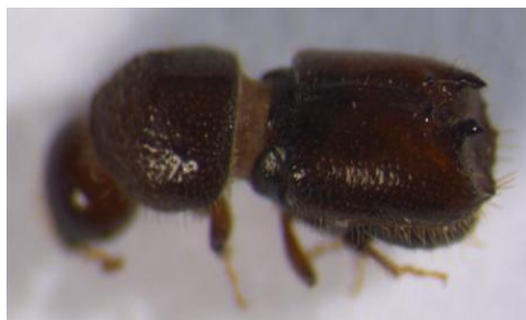
Figura 39. Pityogenes calcaratus . Vista lateral.

Descripción: tamaño 2'0-2'5 mm, alargados y cilíndricos. Pronoto con bandas de espículas transversas en su mitad anterior. Parte posterior punteada. Funiculo antenar de 5 segmentos. Maza redonda y plana. Los machos presentan 3 pares de dientes en el declive eritral, el 1º muy reducido y el 2º en forma de gancho, pero con el extremo dirigido hacia el frente. Entre el 2º y 3º diente existe un espacio rugoso. En las hembras, los procesos denticulares son diminutos o ausentes. Sin embargo, poseen 2 profundas fosetas laterales en el rostro, a ambos lados del clípeo, delimitándolo claramente (LÓPEZ et al. , 2007).