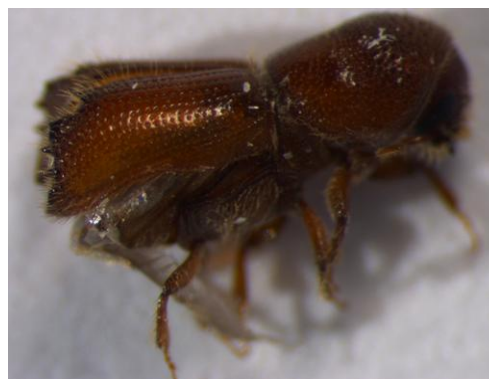
Figura 37. Orthotomicus erosus . Vista lateral.

Biología: especie polígama, en la cual el macho suele aparearse con 2 ó 3 hembras. Puede haber de 2 a 7 generaciones anuales, dependiendo de la zona geográfica y condiciones climáticas. Construye galerías en forma de estrella irregular, con 2-3 galerías maternas que parten de una cámara de acoplamiento (LÓPEZ et al. , 2007). Orthotomicus erosus presenta un periodo de hibernación y está más activo durante los meses cálidos. Los ataques se producen desde marzo hasta octubre sobre árboles debilitados.