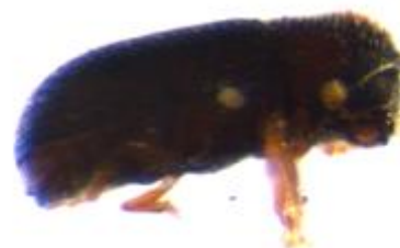
Figura 36. Hypothenemus eruditus . Vista lateral.

Descripción: las hembras suelen ser de mayor tamaño (de 1,0 a 1,3 mm) que los machos (0,7-0,8 mm). Éstos a su vez son raros y braquípteros. Aspecto ovalado. Pronoto redondeado con una elevación en su parte media y 6 gránulos en su parte anterior. Funiculo antenar de 4 artejos en las hembras, 3 o 4 en los machos. Maza subovalada de 3 segmentos, con una digítula. Estrías con una fila de pelos e interestrías con una fila de escamas blancas (LÓPEZ et al. , 2007)