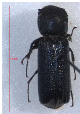
Figura 26. Apate monachus . Vista dorsal.

Descripción: 10-20 mm. Cuerpo cilíndrico, íntegramente negro o pardo muy oscuro; a veces con el abdomen rojizo. Ligeramente dimorfismo sexual que se manifiesta en la frente, la cual aparece glabra en los machos y dotada de una brocha de pilosidad larga y muy abundante, de color amarillo-rojizo, en las hembras, así como en el declive apical de los élitros, que es liso y brillante en los machos y densamente punteado y granuloso en las hembras. Cabeza inserta en el pronoto ventralmente. Labro muy pubescente. Las antenas están formadas por diez artejos, de los cuales los tres últimos forman una maza. Pronoto subcuadrado, superficie pronotal con algunas sedas dispersas, cortas y tumbadas hacia atrás. Escudete triangular, con punteado muy fuerte. Élitros de lados paralelos, algo más de dos veces más largos que anchos. Sutura elitral elevada; disco elitral con tres costillas longitudinales bien marcadas; espacios intercostales con punteado fuerte y profundo. De dicho punteado se origina una pubescencia caediza corta y muy escasa (BAHILLO DE LA PUEBLA et al. , 2007).