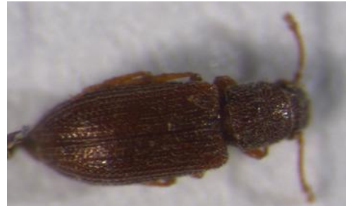
Figura 17. Especie sin identificar nº2. Vista dorsal.