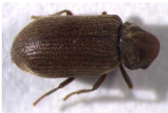
Figura 23. Anobium punctatum . Vista dorsal.

Distribución cosmopolita. Está presente sobre todo en zonas de clima templado (Europa, África del Sur-Oriental, Australia, Estados Unidos, territorios franceses del Oeste y el Sur-Oeste, donde las condiciones climáticas (especialmente humedad) son más favorables para su desarrollo ( http://www1.montpellier.inra.fr/CBGP/insectes-du-patrimoine/?q=en ).