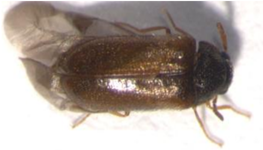
Figura 16. Especie sin identificar nº1. Vista dorsal.

En el siguiente anexo se muestran las imágenes de aquellas especies de coleópteros que se han capturado durante los muestreos, pero que no se han conseguido identificar.