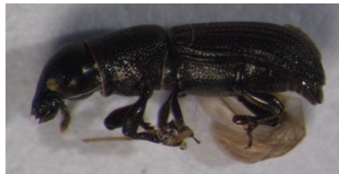
Figura 34. Hylastes ater . Vista lateral.

Biología: especie monógama y floéfga. Suele habitar en la base de los troncos y raíces de coníferas muertas o debilitadas. Es una especie que se siente atraída por la humedad, por lo que también es habitual encontrarla en la corteza de árboles caídos cuando el suelo está húmedo. El inicio del periodo de vuelo se da en marzo, con condiciones climatológicas favorables. En junio se puede observar la cópula en el exterior. Construye galerías maternas unirrámeas, ligeramente oblicuas respecto a la dirección de las fibras de la madera. Puede presentar 2 generaciones anuales si las condiciones son óptimas (LÓPEZ et al. , 2007).