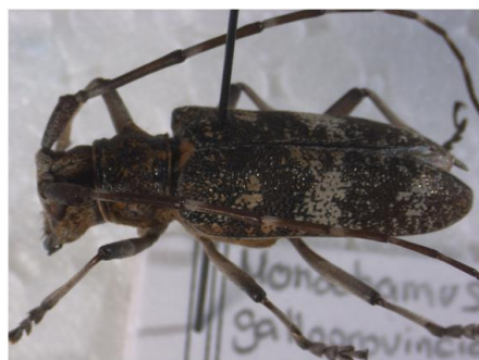
Figura 32. Monochamus galloprovincialis . Vista lateral.

Biología: viven en las ramas muertas de diversos Pinus sp., pero también pueden vivir en Abies , Picea y Larix . Su ciclo dura un año o dos. Los adultos emergen a principios de junio; vuelan a pleno sol hasta finales de septiembre, localizándose sobre la madera muerta de sus fitohuéspedes y ocasionalmente acuden a la luz ultra violeta, lo que indicaría cierta actividad crepuscular (BERMEJO, 2011; VIVES, 2001).