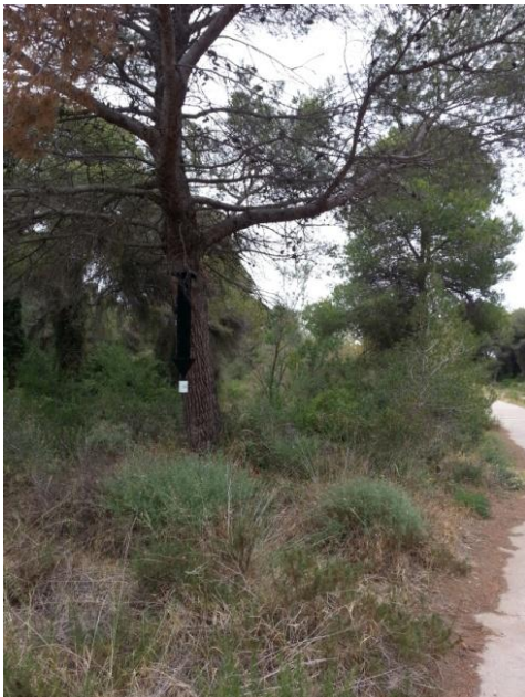
Figura 14. Fotografía de la trampa 8 en campo.