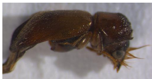
Figura 28. Scobicia pustulata . Vista lateral.

Biología: Normalmente se desarrolla a expensas de madera muerta de encina ( Quercus ilex ), pero también se ha señalado como perjudicial para la viña, donde apenas presenta importancia económica y para el algarrobo ( Ceratonia siliqua ) (BAHILLO DE LA PUEBLA et al. , 2007).