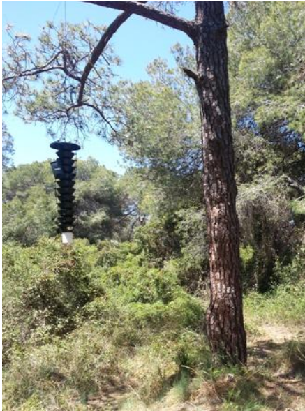
Figura 12. Fotografía de la trampa 1 en campo.

En el siguiente anexo fotográfico se muestran las imágenes de algunas de las trampas del estudio puestas en campo en diversos puntos de la Devesa.