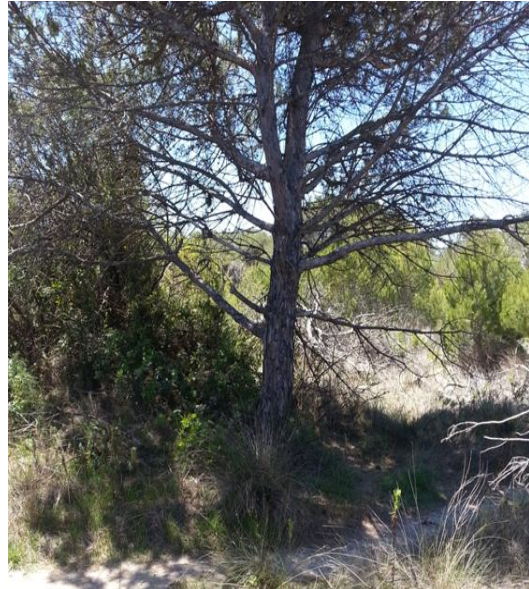
Figura 13. Fotografía de la trampa 4 en campo.