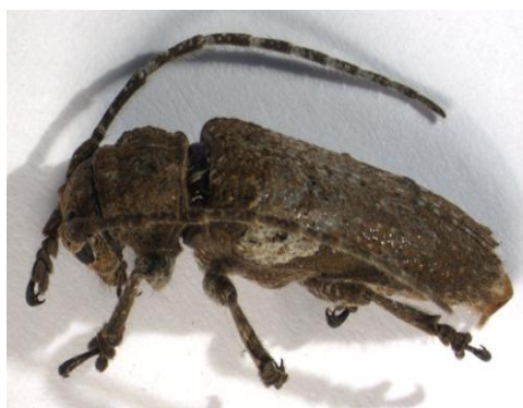
Figura 33. Niphona picticornis . Vista lateral.

Descripción: 12-18 mm. Cuerpo alargado, subparalelo, con tegumentos pardos, cubiertos de tomento pardo y gris, con manchas amarillentas; patas y antenas también grises, con manchas blanquecinas. Antenas largas y robustas, alcanzando el cuarto apical en los machos. Cabeza y pronoto muy rugosos, con tomento grisáceo. Su coloración elitral es muy variable; con una banda clara en su tercio apical y otras oscuras en el ápice, que es truncado. Parte inferior del cuerpo con tomento gris (VIVES, 2001).