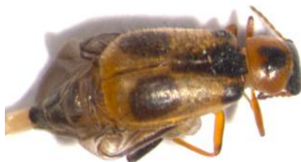
Figura 42. Attalus (Abrinus) pictus . Vista dorsal.

Pronoto poco transverso, una cuarta parte más ancho que largo, ligeramente convexo y amarillo o amarillo anaranjado con una mancha longitudinal negra sobre el disco que no llega a tocar los bordes anterior ni basal. Escudete más ancho que largo, rebordeado en sentido posterior y de color negro. Élitros amarillos testáceos, con una faja sutural negra, estrechada en sentido posterior, que se extiende desde la base hasta algo más allá de la mitad de la longitud de los mismos; en dicho punto y en cada élitro, se observa otra mancha negra oval a subcuadrada que por lo general no alcanza a los bordes laterales ni a la sutura, quedando aislada. Tegumentos con una puntación muy fina, apenas perceptible y de aspecto vagamente subrugoso (PLATA-NEGRACHE et al. , 2010; PLATA et al. , 1990).