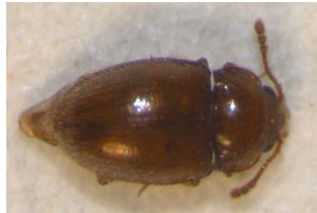
Figura 19. Especie sin identificar nº4. Vista dorsal.