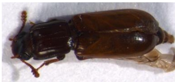
Figura 43. Aulonium ruficorne . Vista dorsal.

Biología: Aulonium ruficorne es un enemigo natural de los escolítidos en las plantaciones de pinos en la cuenca del Mediterráneo. Importante predador de Orthotomicus erosus y Pityogenes calcaratus . Los adultos y las larvas de A. ruficorne se alimentan de larvas, pupas y adultos jóvenes de escolítidos es los troncos de los pinos. Se siente atraído por las feromonas sintéticas de O. erosus (MENDEL et al. , 1990).