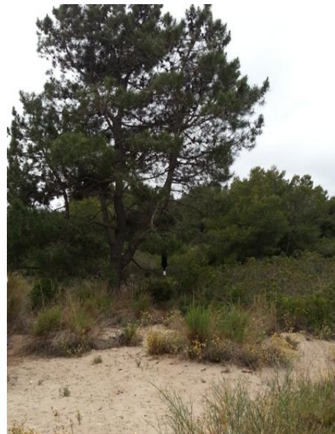
Figura 15. Fotografía de la trampa 10 en campo.