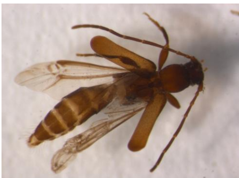
Figura 22. Especie sin identificar nº7. Vista dorsal.