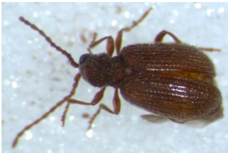
Figura 18. Especie sin identificar nº3. Vista dorsal.