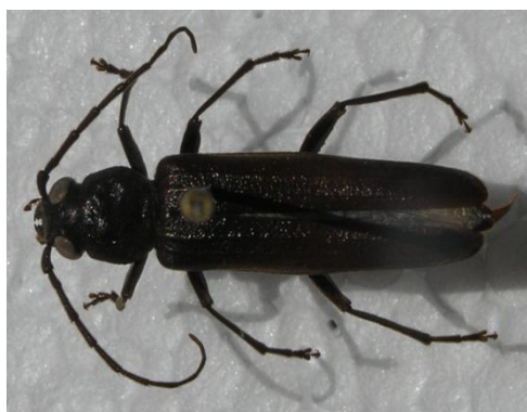
Figura 31. Arhopalus ferus . Vista dorsal.

Descripción: 8-28 mm. Coloración pardo-oscuro o negruzca; existe alguna variedad de coloración más clara, propia del Sistema Central. Ojos grandes y glabros; antenas de los machos largas, sobrepasando ligeramente el ápice elitral. Cabeza, protórax y élitros finamente punteados, con dos o tres costillas longitudinales. Patas largas y finas, de coloración testácea, con el tercer artejo de los tarsos posteriores hendidos hasta la mitad, lo que le diferencia de sus congéneres (VIVES, 2001).