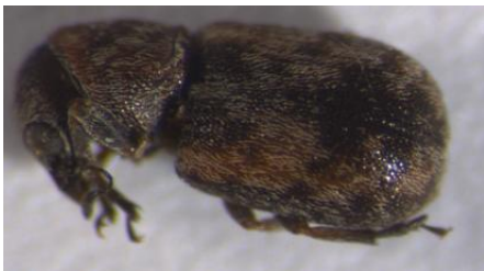
Figura 20. Especie sin identificar nº5. Vista dorsal.