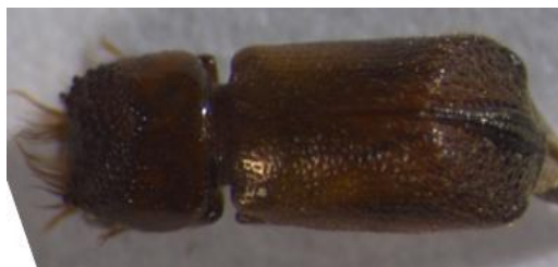
Figura 27. Scobicia pustulata . Vista dorsal.

Morfología: Tamaño de 2,7-4,5 mm. Cuerpo alargado y cilíndrico. Cabeza y región ventral negros; pronoto pardo rojizo; élitros, antenas y patas de color pardo amarillento, con la mitad apical de los élitros oscurecida. Antenas de nueve artejos, con los tres últimos muy desarrollados, formando una maza que, en conjunto, es más larga que los seis artejos que la preceden.