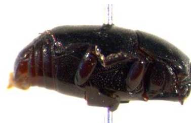
Figura 41. Teretrius (Neotepetrius) parasita . Vista lateral.

Biología: esta especie entra en las galerías subcorticales y depreda las larvas de bostríquidos, anóbidos, líctidos y otros xilófagos que se encuentran (YÉLAMOS et al. , 2000; YUS et al. , 2008).