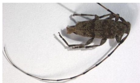
Figura 30. Acanthocinus griseus . Vista dorsal.

Hospedadores: larvas citadas de diversas coníferas como Pinus , Abies , Larix y Cedrus , generalmente de montaña.