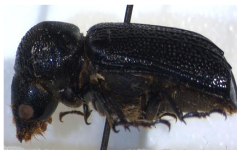
Figura 25. Apate monachus . Vista lateral.

Distribución: Importado a numerosas partes de Europa y América desde África tropical. Registrado en el norte de la Península Ibérica, en Andalucía y en la costa mediterránea. Las citas andaluzas y valencianas sugieren una aclimatación natural en España (LÓPEZ-COLÓN et al. , 1999; BAHILLO DE LA PUEBLA et al. , 2007).