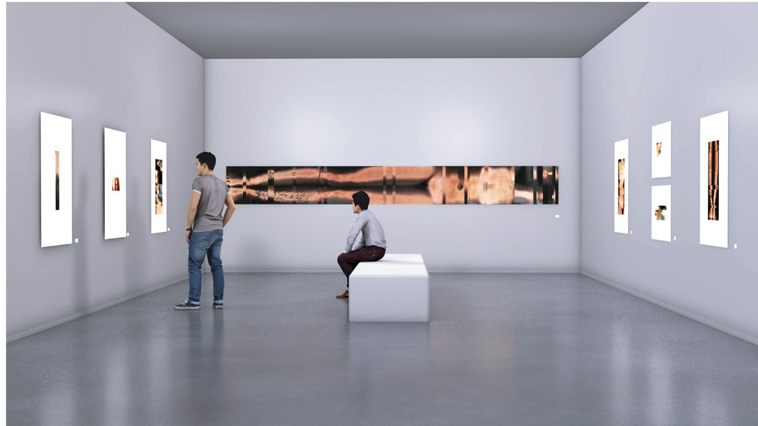
Simulación 2: SUJETO