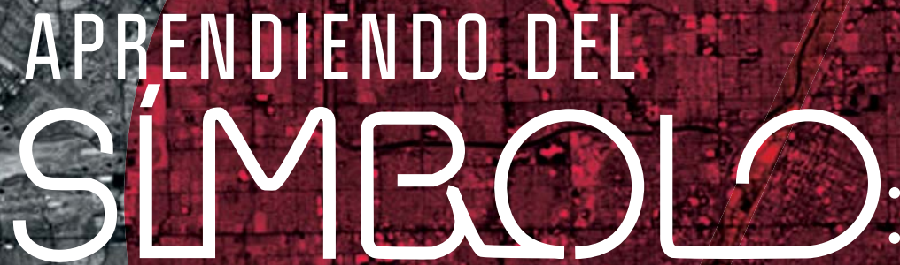
IMAGEN Y REFERENCIA SIMBÓLICA EN LOS INICIOS DEL DISCURSO ARQUITECTÓNICO POSMODERNO

LEARNING FROM THE SYMBOL: Image and Symbolic Reference in Early Post-modern Architectural Discourse