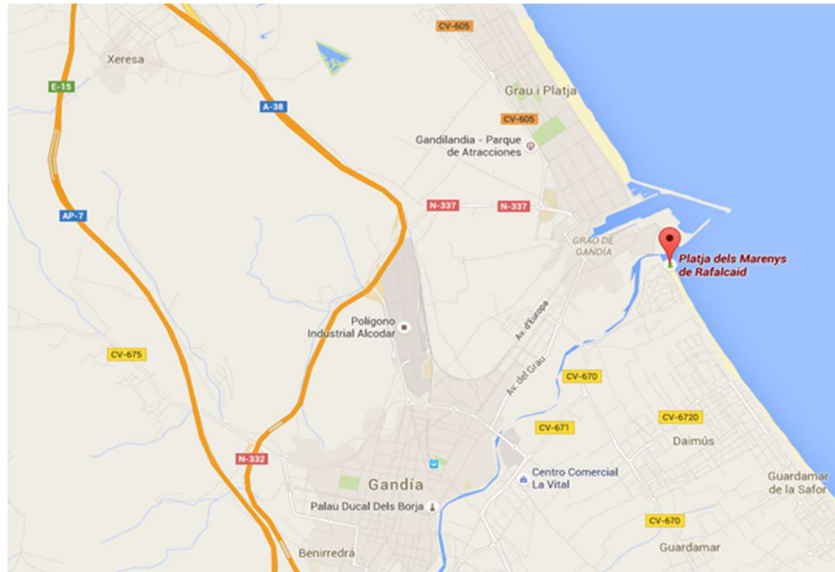
Figura 4. Localización de la playa Rafalcaid.

La playa Rafalcaid es la que más al sur de las cuatro se encuentra y está delimitada por la desembocadura del río Serpis al norte y por el término municipal de Daimús al sur.