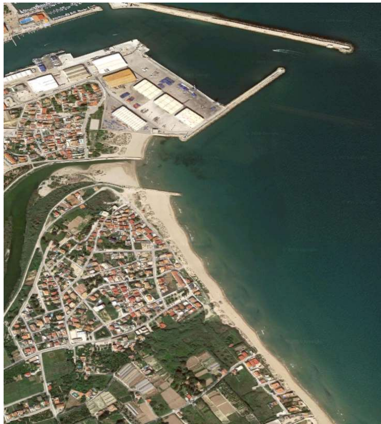
Figura 5. Playa de Rafalcaid.

La playa tiene una longitud de 880 metros y una anchura media de 30 metros, con unos tramos más castigados que otros. En la playa puede distinguirse un primer tramo, inmediatamente al sur del puerto, con mayor presencia de arena debido al efecto protector que ejerce el puerto en esa zona y a la retención de material procedente de la desembocadura del río Serpis y otro tramo a continuación de este que ha sufrido una gran regresión de la línea de costa debido a que el puerto interrumpe la corriente de deriva litoral.