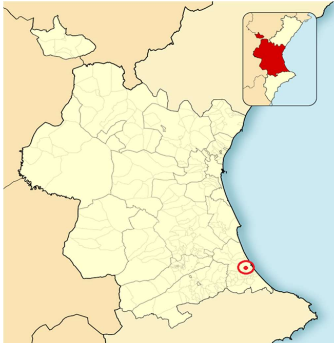
Figura 2. Localización de Gandia en la provincia de Valencia..