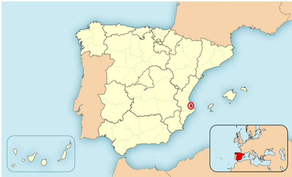
Figura 1. Localización de Gandia en España

Gandia es un municipio que pertenece a la Comunidad Valenciana, España. Se encuentra en la provincia de Valencia, más concretamente en la comarca de la Safor, siendo su capital. Se sitúa a 70 kilómetros al sur de Valencia y a 110 kilómetros del norte de Alicante. Su línea de costa se encuentra bañada por el mar Mediterráneo y cuenta con una población de 75.514 habitantes (INE 2015).